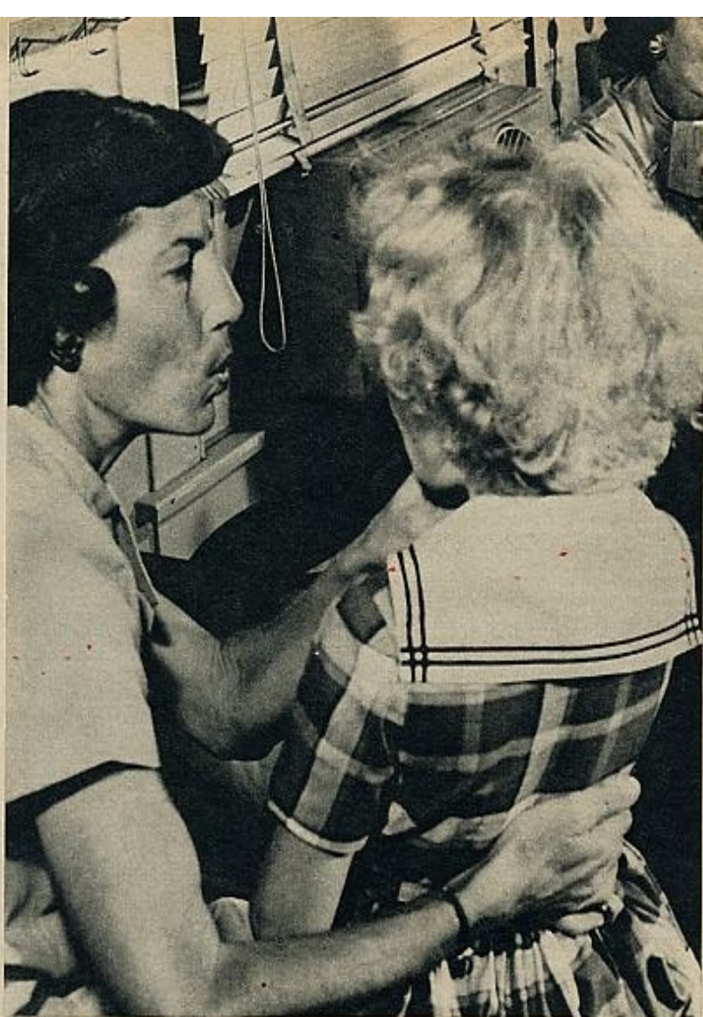
Una maestra de la Escuela de Sordos de Houston, Tejas, enseña a una alumna la formación de las palabras valiéndose del lenguaje «labial». El niño aprende a leer en los labios de su interlocutora.

E S de fundamental importancia descubrir lo antes posible las causas de las deficiencias auditivas en los niños. Sólo así, detectando y diagnosticando la sordera en la infancia y suministrando la oportuna orientación a los padres, será factible remediarla o, por lo menos, atenuarla.