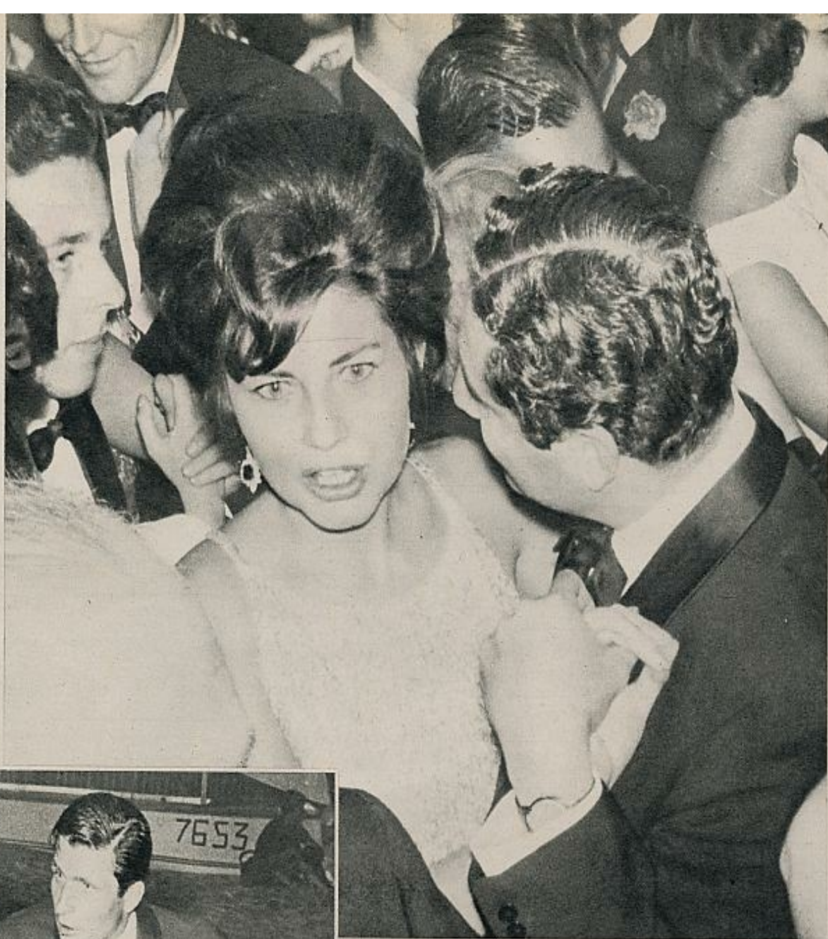
En el verano de 1962, Soraya y el «play boy» Gunter Sachs von Opel, formalizaron su compromiso matrimonial. Sin embargo, meses después —foto superior— podía verse a la princesa bailando con Sandri Khan en una fiesta benéfica.