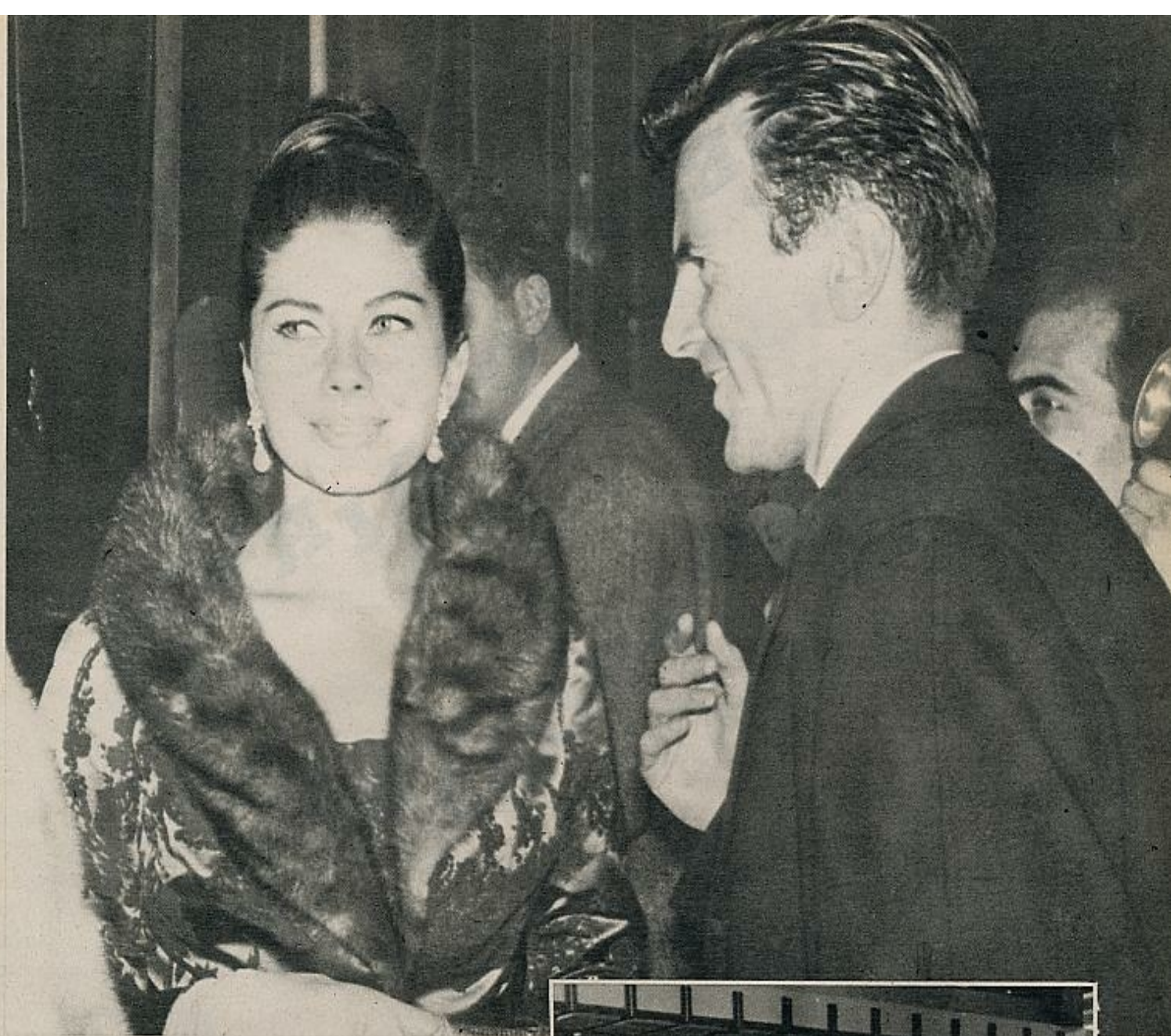
Con el actor austriaco Maximilian Schell también se habló de boda, pero a última hora no ha habido acuerdo entre los dos. En la foto inferior, Alberto Sordi y Silvana Mangano acompañan a Soraya al avión que la conduciría a Munich.