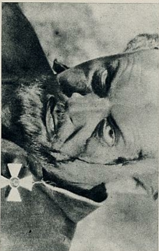
«La última orden»

luz, como gran factor constructivo de la escena. Las masas juegan ya como grandes protagonistas, más que como coro, aunque desista el actor y su individualidad, contra el criterio de la escuela de Meringen. Las innovaciones de su técnica teatral, como los escenarios divididos, múltiples, giratorios, los decorados sintéticos, profugos, el cine. De ahí saldrá Paul Wegener y su expresionismo cinematográfico inicial.