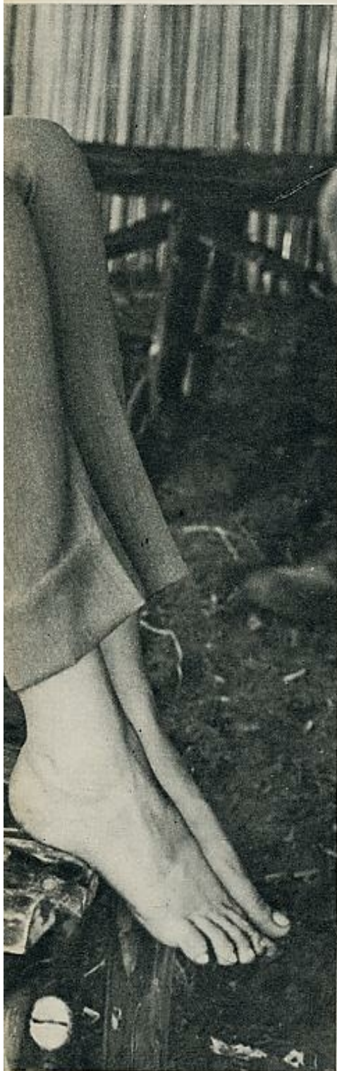
En las dificultades descansa y sonríe entre plano y plano.

C ARROLL Baker es una de esas actrices cuya popularidad oscila continuamente y cuya cota sube o baja en pocos meses de modo espectacular. Lanzada por Elia Kazan, hace unos años, en aquella famosa «Baby Doll» que nunca llegó a nuestras pantallas, su primer éxito fue de escándalo. Muy joven entonces, unía a su aspecto casi de niña una perversidad que hizo sensación. Luego, contra lo que podía suponerse, se la encasilló en papeles de muchachita ingenua, a veces tasteruda. De nuevo el año pasado su cotización volvió a subir, y de nuevo con un film escandaloso, que retrazaba —en adaptación libre— la vida de Jean Harlow, la estrella celebrísima de los años treinta SIGUE