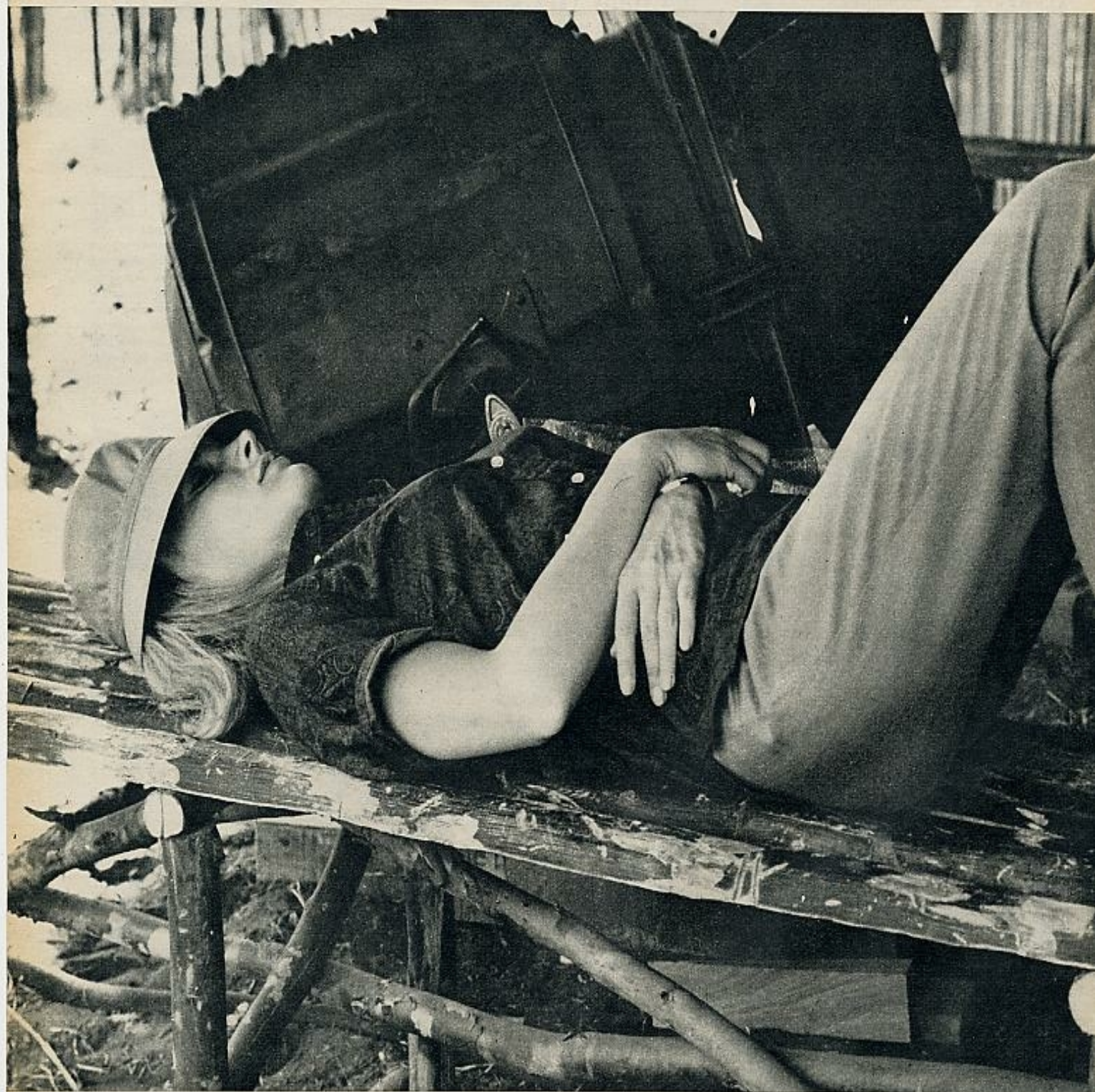
Carroll Baker interpreta una nueva película, esta vez en el corazón de África, en Kenia, titulada «Mister Moses», reactualización del mito de Moisés. Y, sin arredrar