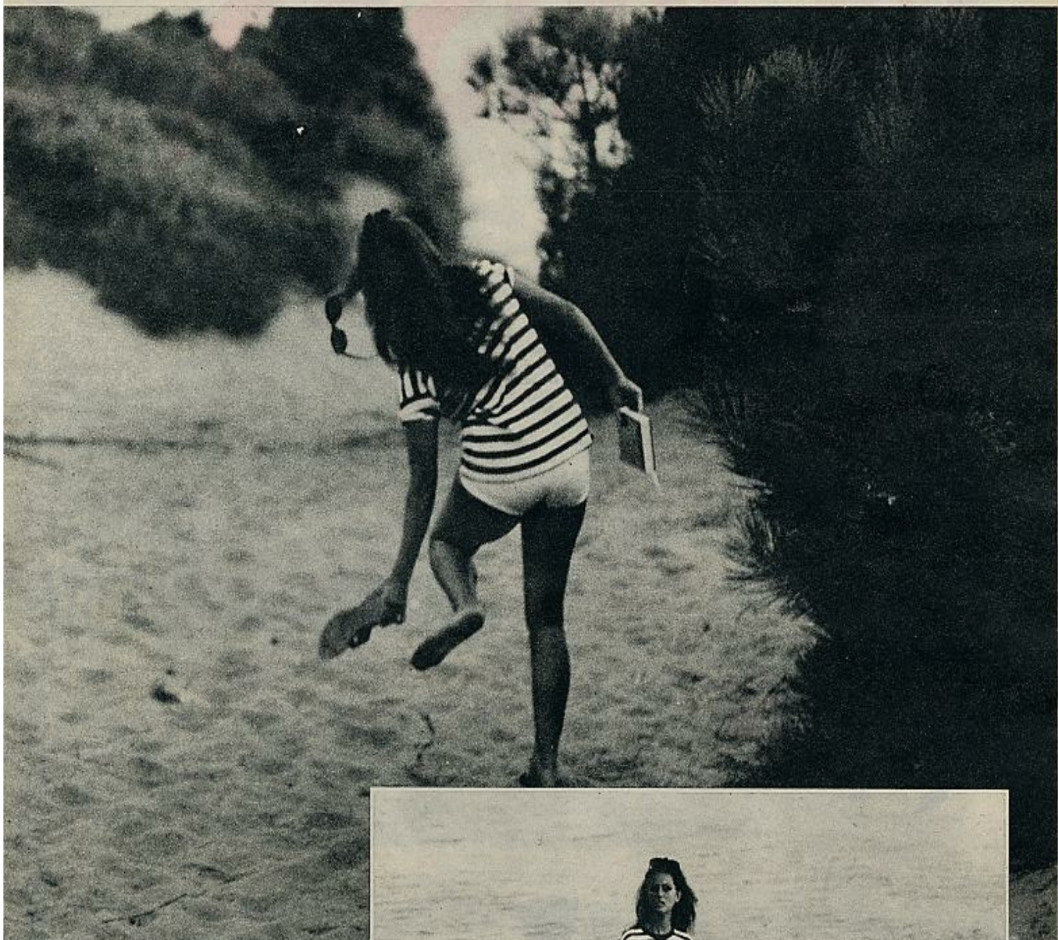
un libro a medio leer, Claudia Cardinale pasea a la orilla tagoniza ahora «Vaghe stelle dell'Orsa», de Visconti.

térprete —«Rocco y sus hermanos» y «El gatopardo» fueron las dos ocasiones anteriores—. Ahora, de nuevo bajo las órdenes de Visconti, Claudia protagoniza «Vaghe stelle dell'Orsa».