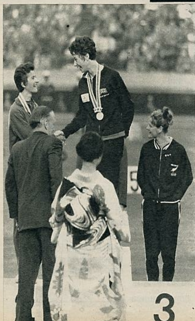
La final de los 800 metros femeninos fue emocionante; en la última recta, en un sprint irresistible, la inglesa Anne Packer desbordó a la favorita, la francesa Maryvonne Dupureur. Inmediatamente, la ganadora fue a ofrecer su triunfo a su prometido, el corredor de los 400 metros Brightwell. Luego, en el pódium de honor, la Packer estrecha la mano de su contrincante francesa —medalla de plata— en presencia de la neozelandesa Anne Chamberlaine —medalla de bronce—.