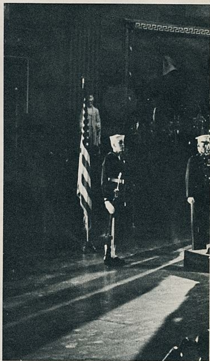
A un año del crimen de Dallas, en Occidente no ha terminado la «era Kennedy».

L OS balazos de Dallas mataron a John Fitzgerald Kennedy hace un año. No es fácil coger el fruto de este aniversario. El mito y leyenda han enredado rápidamente su muérdago en la estatua del héroe joven, dejan apenas ver sus auténticos perfiles. Su irradiación domina aún el mundo: en Occidente no ha terminado aún la «era Kennedy».