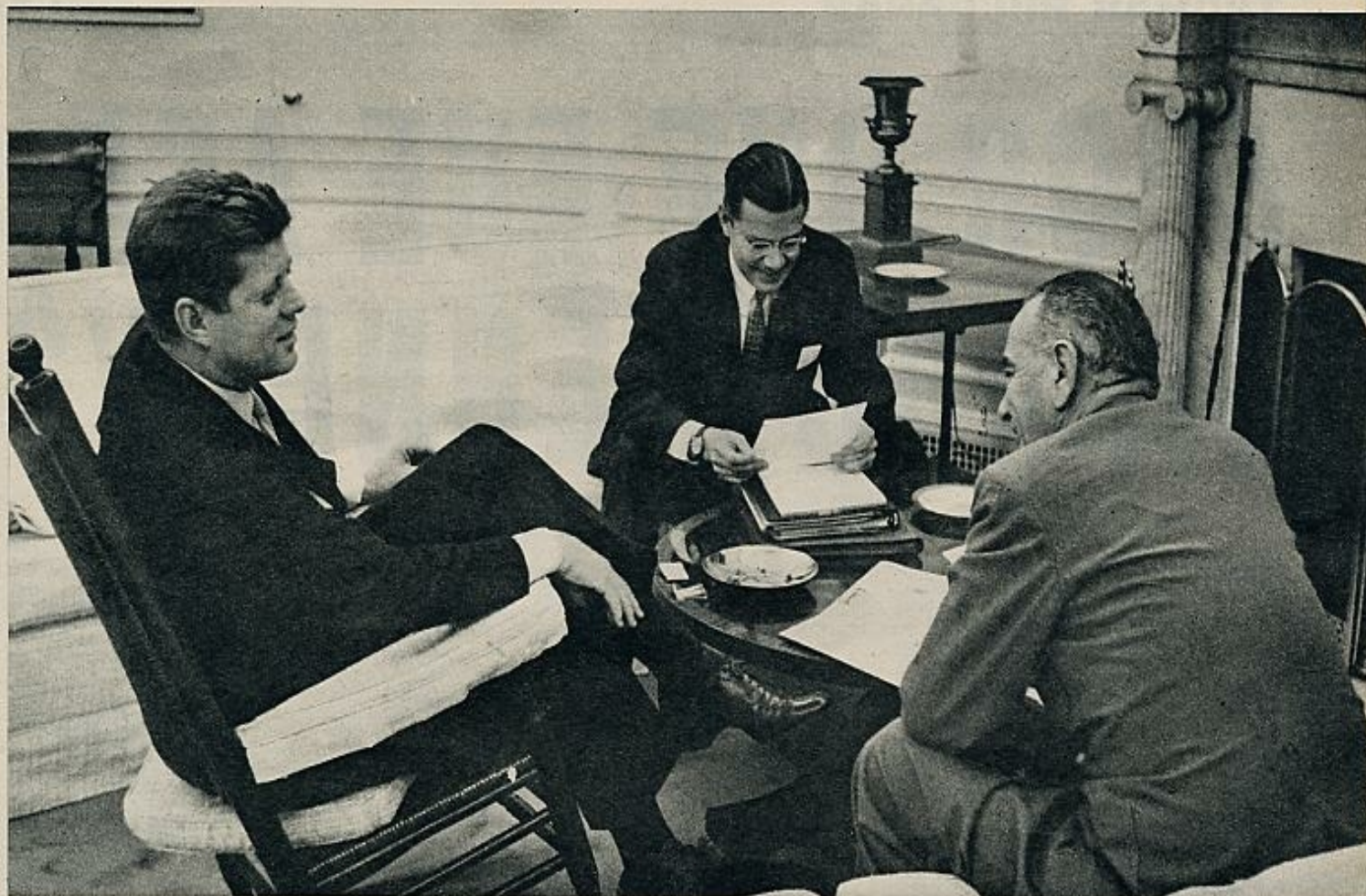
J. F. Kennedy, en su despacho, conversando con el entonces vicepresidente Johnson y con su secretario de Defensa, Robert Mac Namara, y, abajo, Jacqueline orando en Arlington, ante la tumba de su esposo, pocos días después del asesinato.