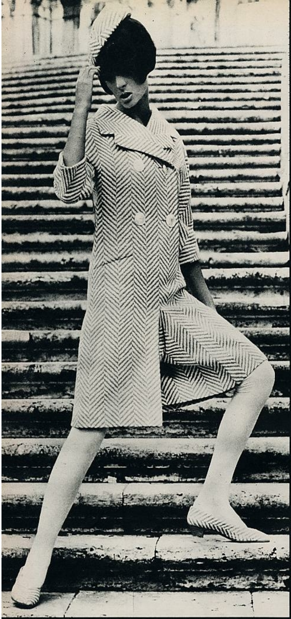
La línea clásica de este vestido, realizado en lana blanca y gris formando una espiga gigante, se hace moderna por el detalle de la falda pantalón. Zapatos haciendo juego, en tela. FORQUET.