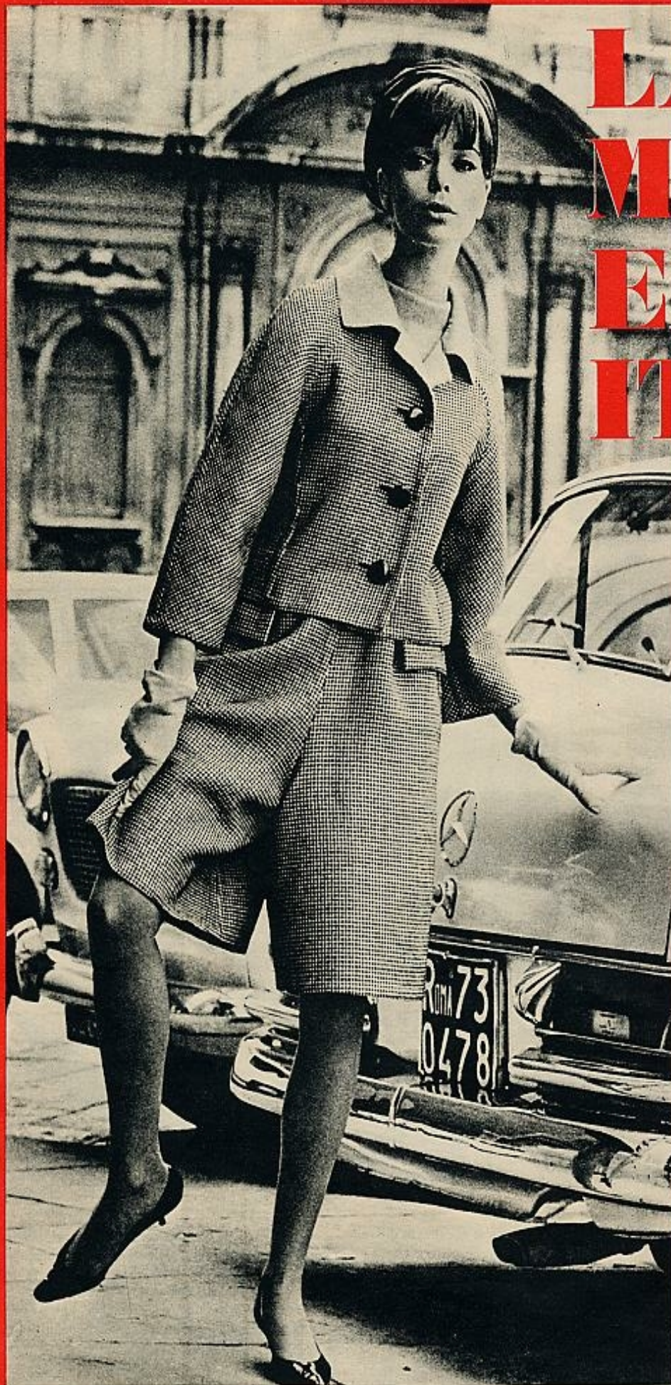
La falda pantalón se repite con frecuencia, especialmente en los trajes de chaqueta como éste, en una lana de pequeños cuadros, reversible, y que se lleva con una blusa del mismo tejido vuelto. FABIANI.

Predominan dos: el blanco y el azul marino. Pero todos los tonos pastel, a menudo profusamente mezclados, aparecen en las colecciones.