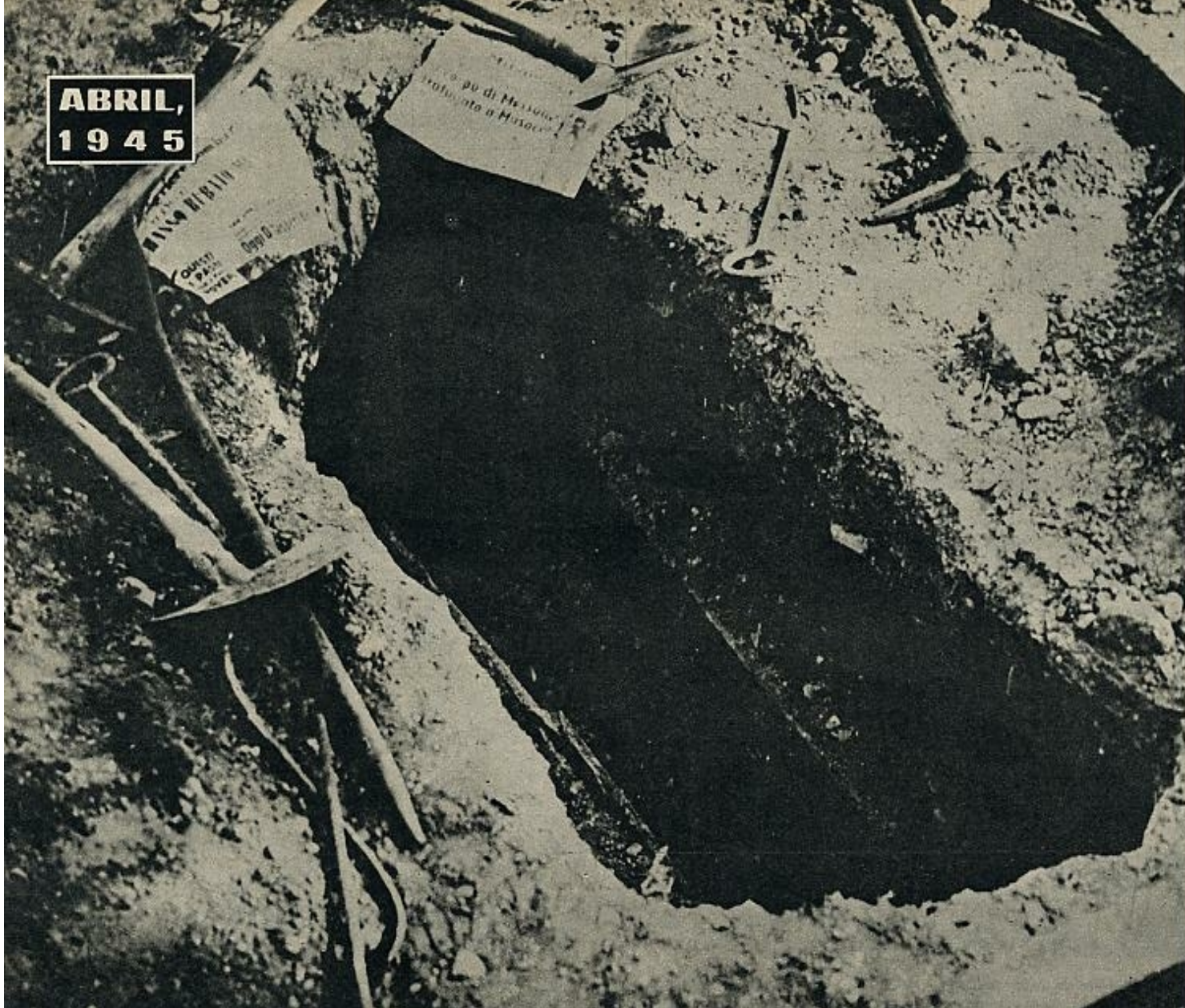
El cadáver del «Duce» fue trasladado a Milán, tras su fusilamiento en Dongo, junto a Clara Petacci. Los cadáveres de ambos fueron expuestos públicamente. El de Mussolini fue enterrado solo, en Milán, pero posteriormente sus partidarios lo robaron. En la fotografía, la primera tumba tal y como apareció abierta.