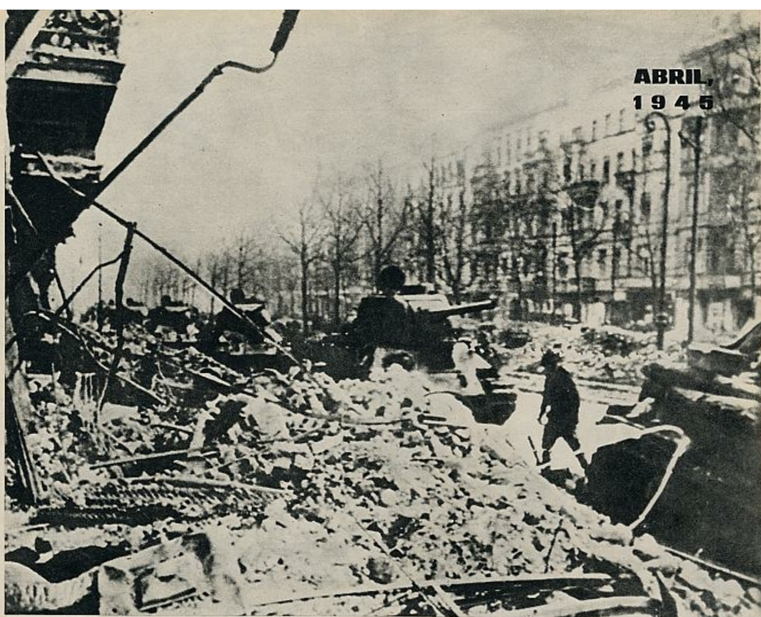
Los tanques soviéticos llegaron, por fin, a Berlín, después de una marcha victoriosa que se había iniciado en Stalingrado. Los tanques llegaron hasta la Cancillería alemana, donde se encontraba Hitler a punto de suicidarse, y hasta la Columna de la Victoria, en la que hoy lleva el nombre de Avenida del 17 de Junio.