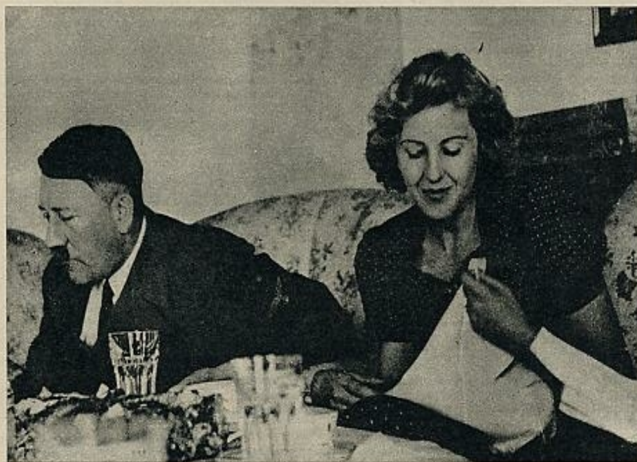
Hitler se suicidó en el «bunker» de la Cancillería cuando ya los rusos habían entrado en Berlín. Eva Braun se había suicidado poco antes. Berlín humeaba entre ruinas y explosiones, casi destruido tras los días de asedio.

redactar un documento imposible, del cual encargó al jefe del Estado Mayor de las Fuerzas Aéreas, general Köller, con esta difícil instrucción: «Hay que hacer creer a los rusos que queremos continuar la guerra en el Este y el Oeste; pero los americanos y los ingleses deben comprender que no queremos ya combatir contra ellos, sino solamente contra los soviéticos. Al mismo tiempo, nuestros soldados deben comprender que la guerra continúa, pero que se acerca un final favorable para todos nosotros».