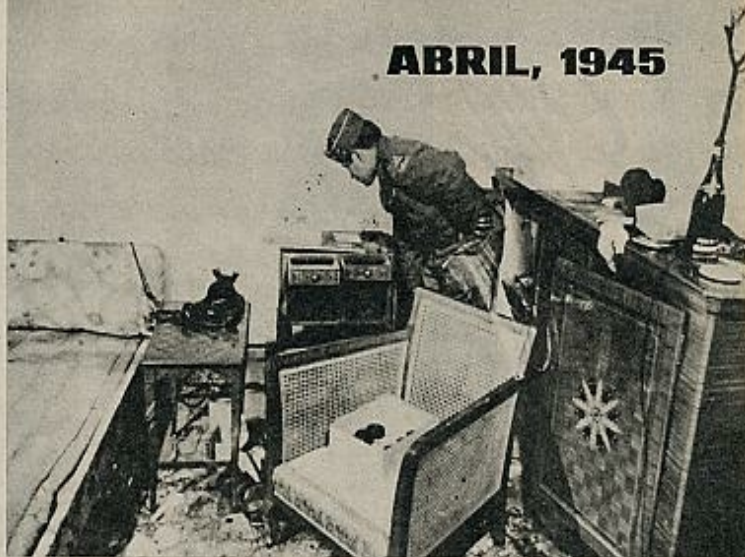
Un soldado norteamericano visita, tras la caída de Berlín, el «bunker» donde se suicidaron Hitler y Eva Braun, poco tiempo antes de la llegada de los rusos.