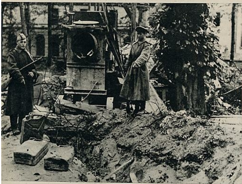
Los soldados soviéticos mostrando, en el jardín de la Cancillería, el lugar donde el cuerpo de Adolfo Hitler fue enterrado, tras haber sido incinerado, según las órdenes que había dado el propio «Führer».

E N MILAN, EL CAMIÓN CON LOS restos del fascismo llegó a un garaje de la ciudad. Se había reunido una enorme multitud para verlos. Un coloso, en mangas de camisa, los iba sacando del fondo del camión, mostrándolos a la multitud, que rugía y escupía, y pronunciando sus nombres. Alguien pensó que sería mejor colgarlos como reses en una carnicería. Mussolini, Claretta, Pavolini, fueron colgados por los pies en unos faroles de una plaza pública; la masa pasaba y escupía sobre estos restos humanos que se balanceaban trágicamente movidos por una ligera brisa. Muchos de los que escupían estaban tratando ya, en el último momento, de hacer olvidar su pasado. Desde Londres, Churchill tuvo, al día siguiente, las últimas palabras de amistad para quien había sido su amigo, para el hombre al que secretamente había admirado: «El asesino de Mussolini se enorgullece en una confesión pública que aparece en el Daily Express (luego se comprobaría que esta confesión era más bien fantástica) de la manera páfida y cobarde en que ha realizado su acto. Declara, en particular, haber matado a la amante de Mussolini. ¿Figuraba esta mujer en la lista de criminales de guerra? ¿Quién le ha dado autoridad para matar a esta mujer? Creo que