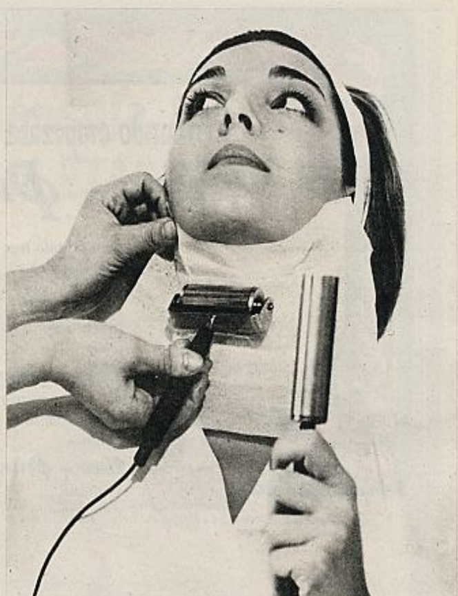
Sigue a esta operación una especie de «planchado», el cual es efectuado con un rodillo eléctrico, mientras la cliente sujeta un electrodo negativo.