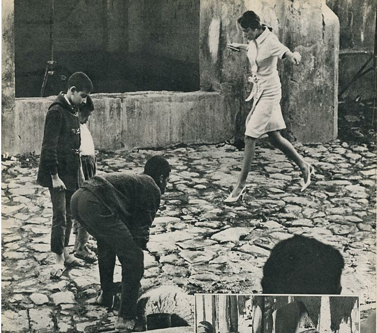
En la película que actualmente interpreta a las órdenes de Claude Chabrol —foto inferior—, Marie Laforêt interpreta el personaje de Marie Chantal, popularísimo en Francia, y una de las secuencias claves es aquella en la que la actriz se ve perseguida a través de las callejuelas y vericuetos de la casbah.