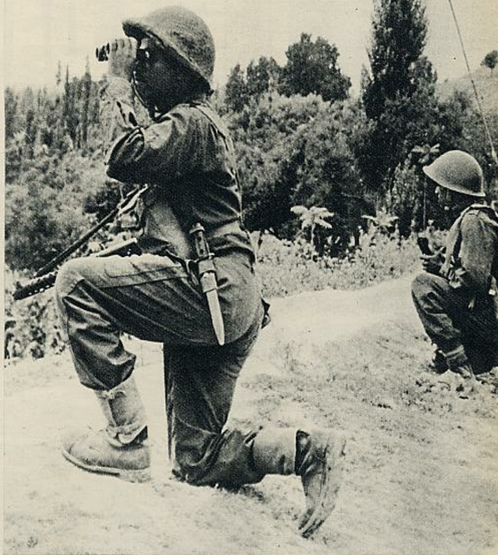
Las hostilidades continúan. Sobre estas líneas, soldados de un destacamento indio en acción. Abajo, el secreto y la India, donde ahora se encuentra. A la derecha, los embajadores indio y pakistaní en la ONU, antes de

Nombrado primer ministro en 1958 por el Presidente Mirza, Ayub Khan se vio ratificado en su mandato por un plebiscito celebrado en 1960. Nació en Abbottabad en 1908 y fue ministro de la Defensa de 1954 a 1955, retirándose posteriormente de la política hasta su incorporación más definitiva a ella, contando, desde entonces, tanto o más su condición de militar que la de político, condición en la que se distinguió especialmente a raíz de la campaña de Birmania, que hizo al servicio de las tropas entonces angloindias.