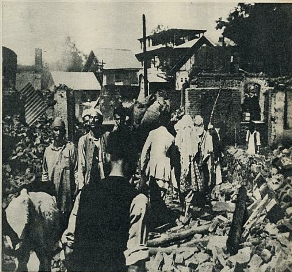
Mientras las calles de Batmaloo quedaban en el estado que muestra la foto superior, los estudiantes indonesios —abajo— se manifiestan ante la Embajada india para, de este modo, expresar su protesta.