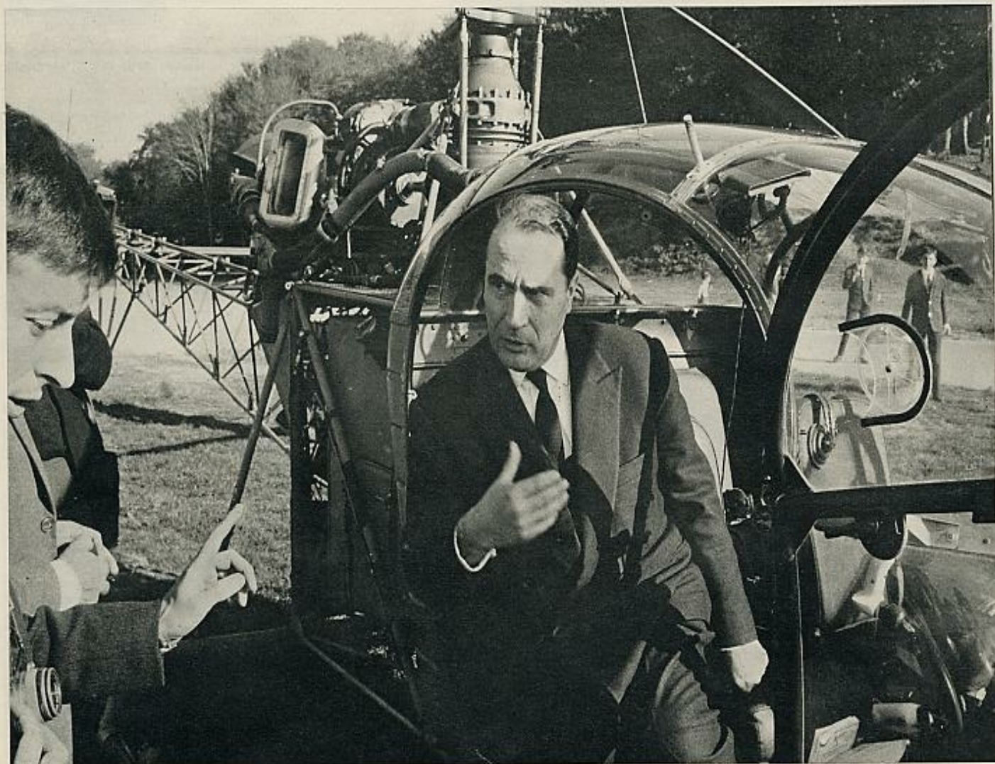
Mitterrand ha realizado su campaña electoral por las zonas rurales utilizando un helicóptero. Aquí se le ve con un campesino, al que trata de convencer.

dos que le apoya, por la vaga ilusión de volver a crear una izquierda en un país donde hace diecisiete años que la izquierda no existe; su pasado de combatiente, resistente y ministro le ayuda en unos puntos, le perjudica en otros —ha estado envuelto en dos escándalos que probablemente eran dos calumnias, pero «algo queda»—. Puede prescindirse del pasado. En el presente ofrece un programa sólido, concreto. Pero su estilo oratorio le hace un poco «cuarta República». La Cuarta República ha sido desprestigiada abundantemente por el nuevo régimen, y se ha creado un mito que la equipara al caos. Lo cual no es históricamente cierto. La IV República produjo un impresionante tren de leyes sociales y de protección a la familia, consiguió la nacionalización de las hullas, del gas, de la electricidad, de grandes empresas bancarias y de seguros, saldó la costosa e inútil guerra de Indochina, creó el «Plan Monnet», que comenzó la auténtica integración de la industria, la agricultura y los sindicatos franceses, y la sensación de desorden político que produjo estaba realmente creada por los enemigos de la República y del régimen de partidos, hasta desembocar SIGUE