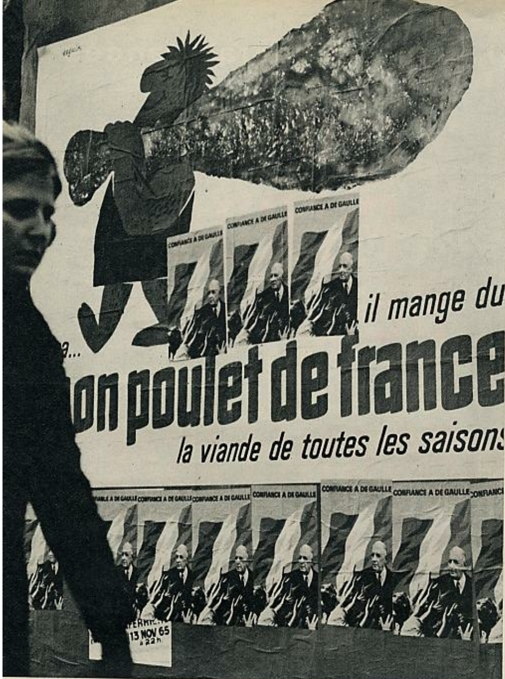
La propaganda política cubre las vallas publicitarias de Francia. Sobre un cartel gigante, en el que se invita a comer pollo en todas las estaciones del año, la efigie del general de Gaulle, respaldada por la bandera nacional, invita a los franceses a votarlo en las próximas elecciones del 5 de diciembre.

su vida. El otro final posible de la tragedia es un «happy end», un final feliz: el anciano solitario y poderoso vence en la lucha a los pretendientes malsanos y, como un San Jorge, después de haber salvado a la pequeña y asustada «Marianne» —la Francia eterna— se aleja hacia nuevas aventuras. Si la textura, la composición de la obra es esa, su tesis es esta otra: la batalla entre el hombre histórico y los hombres políticos; esto es, entre aquel que es capaz de sintetizar el pasado y contemplar el porvenir de un solo vistazo fecundo, considerando el presente como un simple tránsito, y los hombrecillos políticos vivaqueando sobre el terreno, aspirando a poderes pequeños, repletos de ambiciones y deseos personales. Es, en fin, Ulises-de Gaulle en su palacio, donde Penélope-Marianne teje y desteje su tapiz en la larga espera de la fidelidad, Ulises-de Gaulle tensando como nadie lo puede hacer el arco rudo del combate y volviendo las flechas del