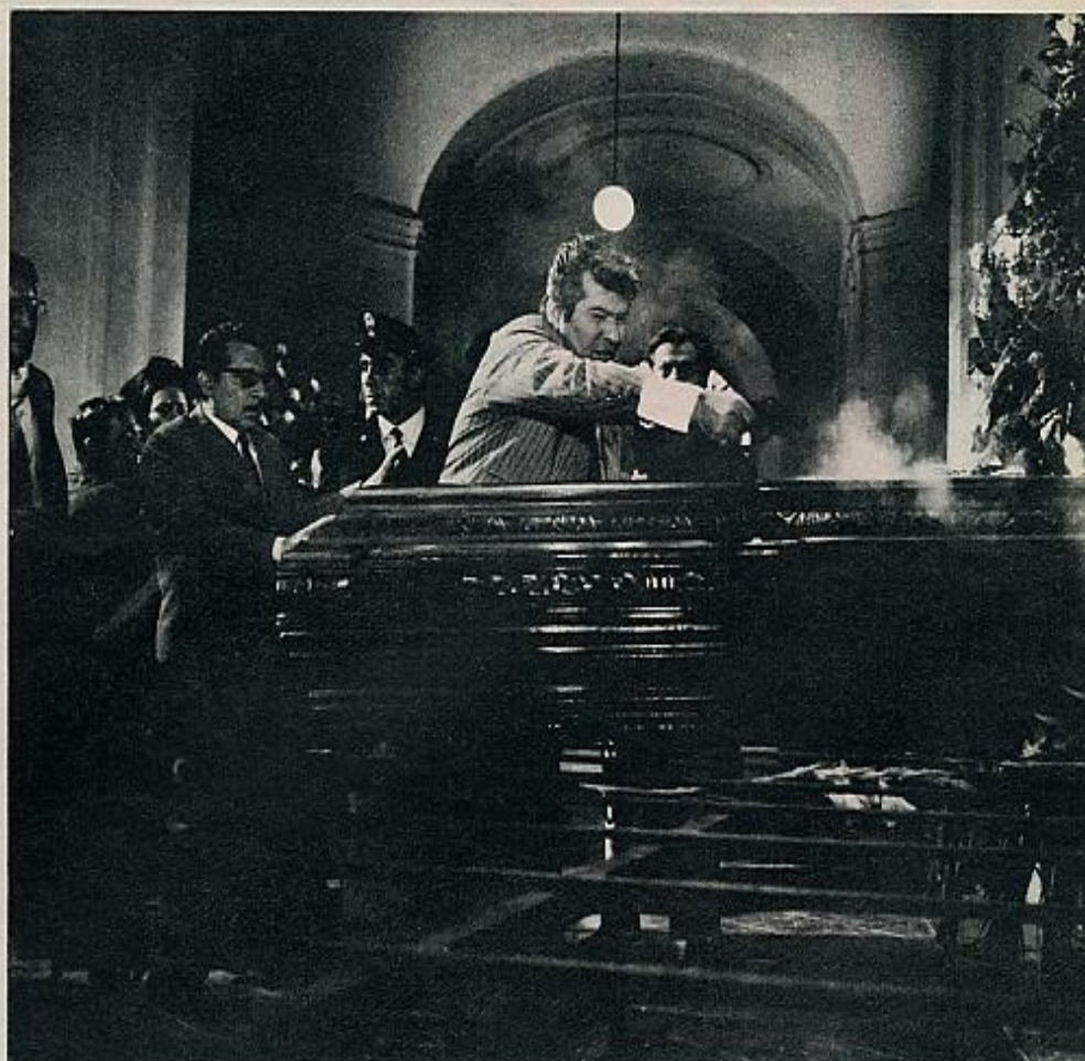
La película es una fantasía humorística que tiene como nexo argumental los extraños sueños del personaje que encarna de que sus sueños se transforman siempre en realidad—. Irrumpe en el velatorio, pero cuando abren el ataúd, en