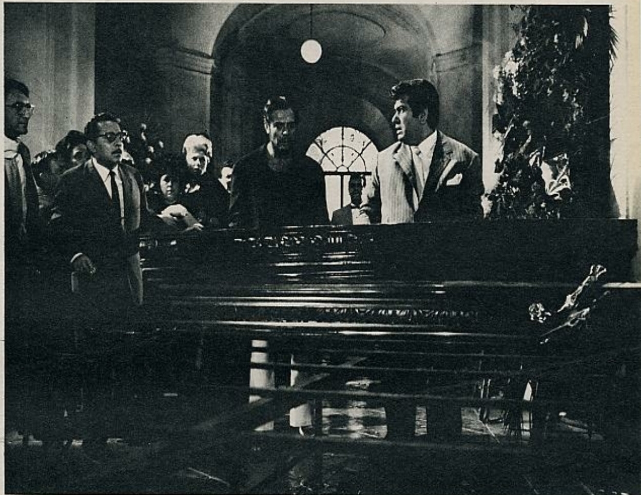
Mastroianni; en uno de esos sueños cree ver el asesinato de un gangster buscado por la justicia. Al despertar, corre a comunicar el hecho a la policía —pues está convencido vez de cádaver aparece un buen montón de patatas. «Dispara fuerte, más fuerte... no comprendo» está realizada por Eduardo de Filippo, un prestigioso actor italiano.