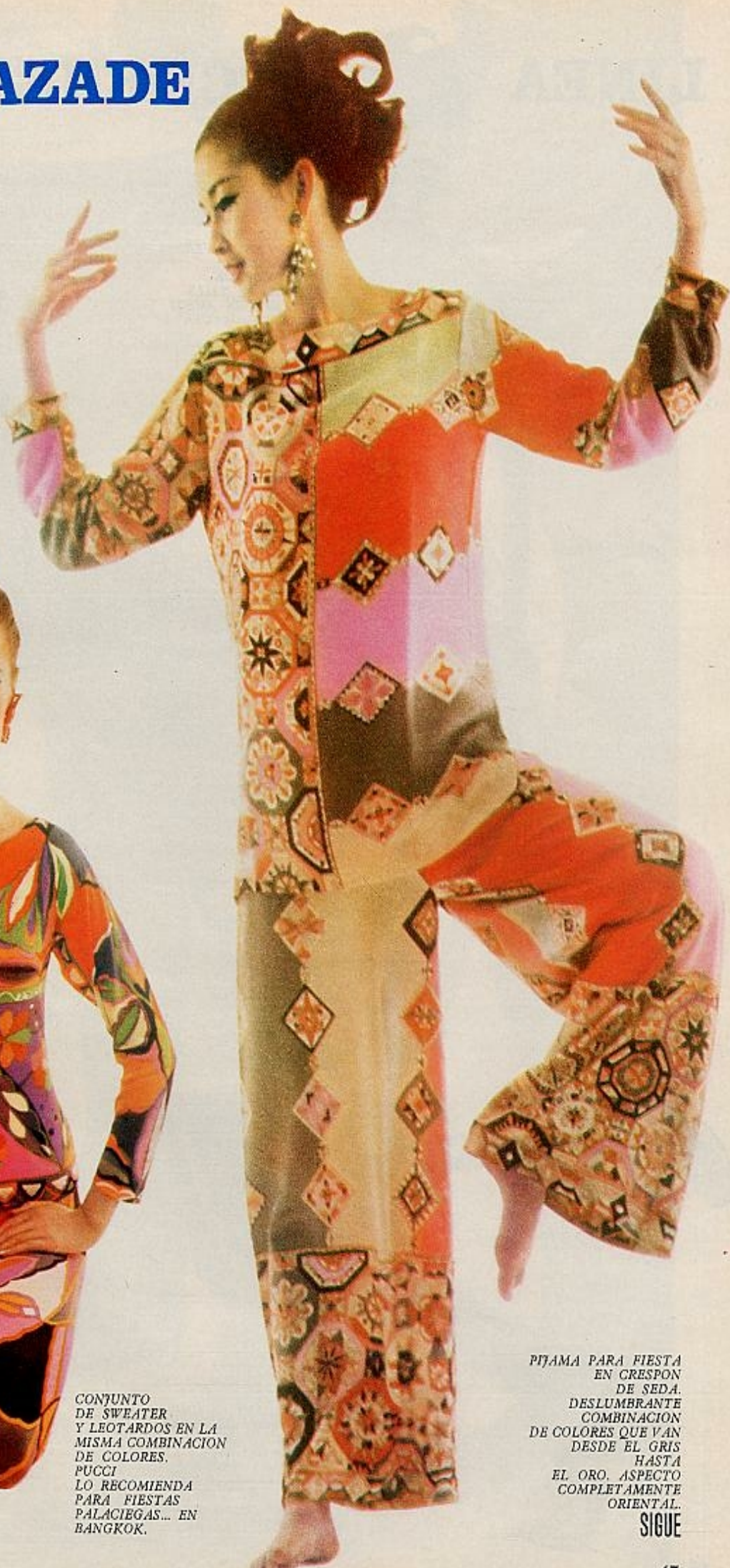
PIJAMA PARA FIESTA EN CRESPON DE SEDA. DESLUMBRANTE COMBINACION DE COLORES QUE VAN DESDE EL GRIS HASTA EL ORO. ASPECTO COMPLEMENTARIE ORIENTAL. SIGUE