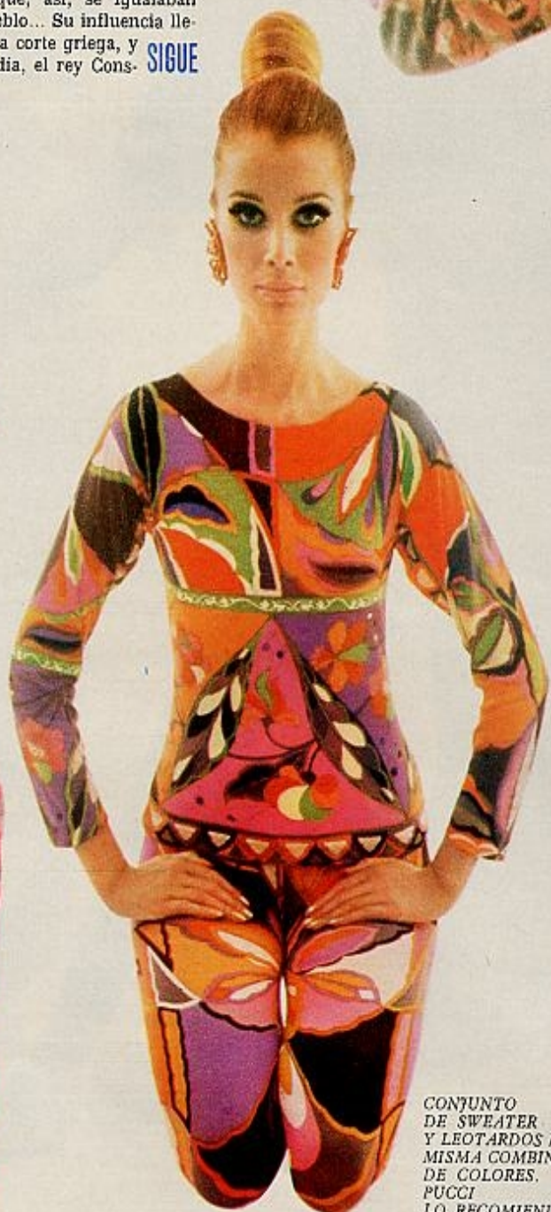
CONJUNTO DE SWEATER Y LEOTARDOS EN LA MISMA COMBINACION DE COLORES. PUCCI LO RECOMIENDA PARA FIESTAS PALACIEGAS... EN BANGKOK.

El marqués Emilio Pucci fue el iniciador, como es sabido, del holiday look —estilo vacaciones— que alcanzó enorme éxito en las fiestas palaciegas y en las playas de moda. El holiday look pretendía combinar la forma cómoda y funcional de los atuendos playeros con la elegancia y distinción requeridas en una fiesta mundana: la contradicción surgía al aceptar que en el núcleo social al que iba dirigida esa moda podía haber esa superficial democratización. La verdad es que la idea tuvo éxito y los muy concretos consumidores que recibían la oferta se hacían la ilusión de que, así, se igualaban con el pueblo... Su influencia llegó hasta la corte griega, y un buen día, el rey Cons- SIGUE