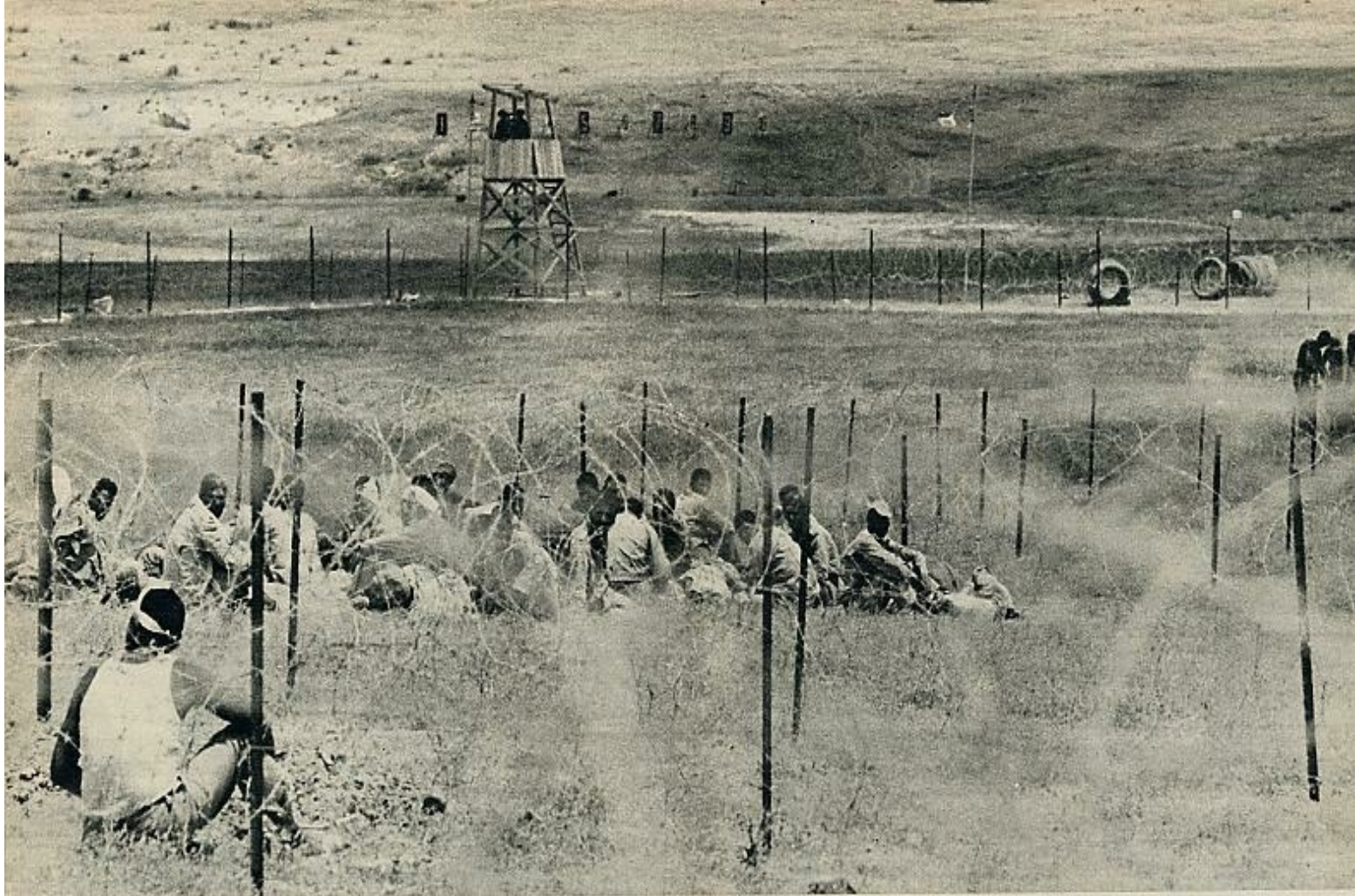
En los campos de alambradas no hay defensa posible contra el sol. Los judíos los montaron rápidamente en la zona de El-Arish, próxima al canal. El agua es el mayor problema de estos campos, donde los prisioneros padecen sed. No hay un solo pozo en muchos kilómetros a la redonda.