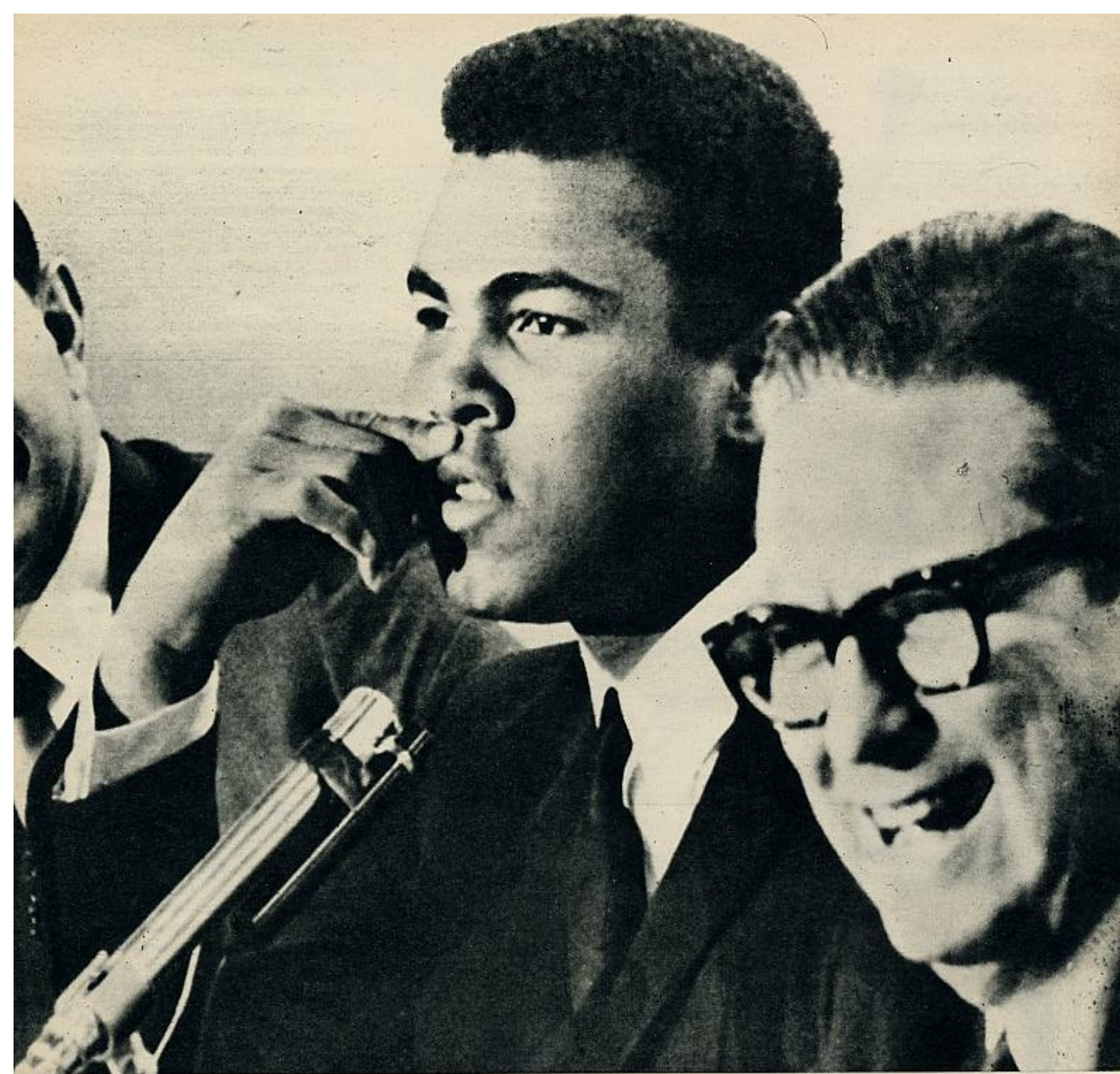
El campeón mundial de pesos pesados abandonó la sala del juicio de Houston tranquilo, reflejando esa «paz interior» que, según él, consiguió el día que supo que era algo más que un simple —aunque el mejor de todos— boxeador. Le acompañaba su procurador (foto inferior de la izquierda). A la salida, firmó autógrafos. Sobre estas líneas, un aspecto de la rueda de prensa celebrada en Houston en la que soslayó sistemáticamente la cuestión de su negativa a cumplir el servicio militar.

L OS guantes en alto, levantados los brazos formando arco sobre su cabeza, formidable sobre el ring, fresco, casi intacto después del match, gritando de alegría, mostrando su blanquísima dentadura, brillante su piel de color, ante su contrincante tumbado, sangrante, abiertos los brazos y laxo el cuerpo, ya sea Cleveland Williams, Henry Cooper, Sonny Liston... Esta imagen de Cassius Clay expandida por los millones de receptores de TV, transmitida de un continente al otro por el «Early Bird», choca con las descripciones del actual Clay, sentado en el banquillo, masticando chicle, dibujando indiferente, mientras el jurado de Houston escucha alternativamente a su defensor y al fiscal. Mastica chicle con nerviosismo y dibuja, con despectiva indiferencia hacia lo