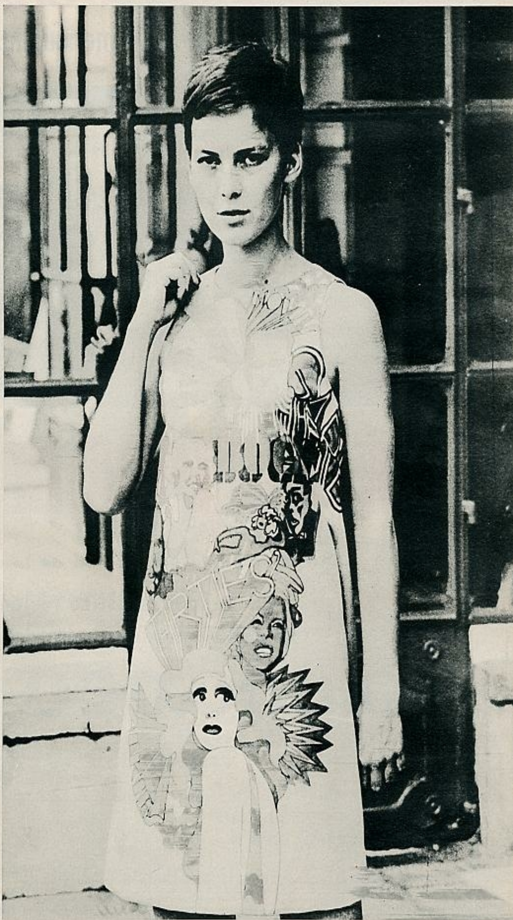
El vestido que luce Mária, lo mismo que el que lleva en la foto que abre nuestro reportaje, está pintado a mano por el español Iván de Zulueta, dentro de la más actual tendencia artística pop, inspirada en el «cómic».