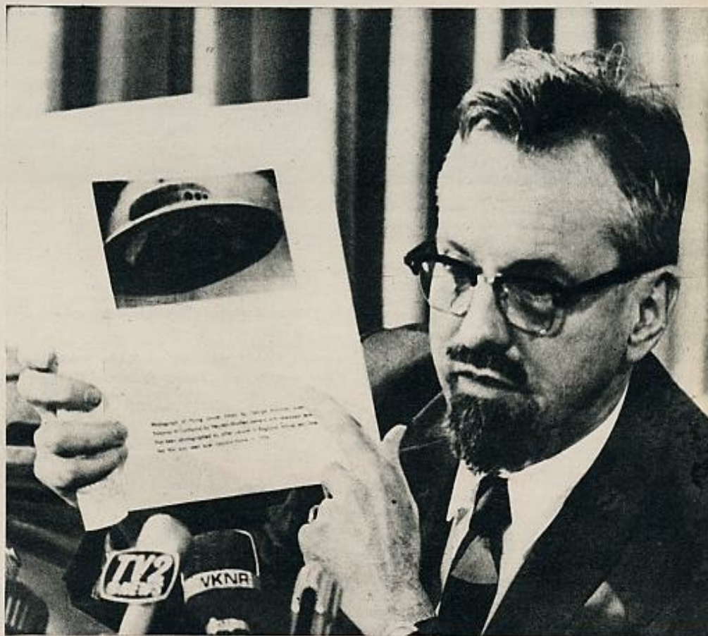
Doctor Hynck, primer experto de la USAF en objetos voladores no identificados y director del proyecto «Stargazer», pronunciando una conferencia sobre «platillos volantes», en Detroit. El doctor fue encargado de investigar el caso del 5 de agosto de 1953 de Black Hawk, South Dakota, al que se hace referencia en el texto.

Los militares perdieron su interés por los «platillos volantes» cuando llegaron a la conclusión de que no se trataba de armas secretas. Constituyó el equipo del «Blue Book», 1952-1966, dos oficia-