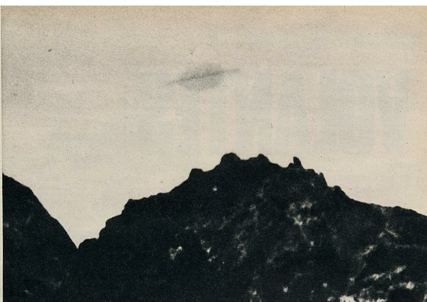
«Platillo volante» sobre la isla de Trinidad (Río de Janeiro) visto el 16 de enero de 1958 por la tripulación del buque brasileño «Almirante Saldanha» y fotografiado por un tripulante. Es uno de los tres casos seleccionados como fidedignos entre las 1.000 comunicaciones enviadas, analizadas por el equipo de la Universidad de Colorado.

ción. Este deseo puede tomar, según Jung, forma de visiones angélicas, redentores divinos... El punto de vista de Jung, con sus variantes más o menos poéticas, valió hasta el año pasado para explicar más o menos satisfactoriamente las historias de «platillos volantes». Sin embargo, no todo el mundo aceptaba la hipótesis psicológica.