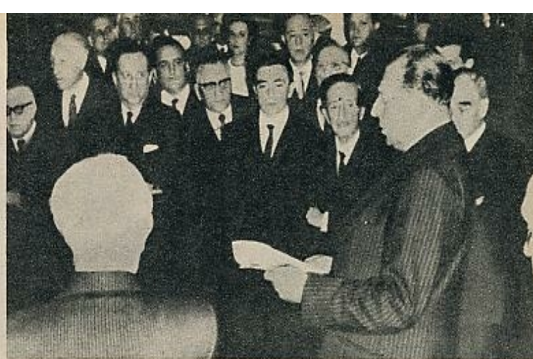
El Conde de Barcelona dirigiéndose a los asistentes a la reunión del 5-III-66.