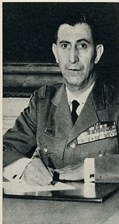
Ailleret, jefe del Estado Mayor francés de los tres ejércitos. Un general «intelectualista» que gustaba, sin embargo, aparecer como un paracaidista. Ailleret ha muerto recientemente en un accidente de aviación. Su puesto, difícil de cubrir, es ocupado interinamente por el general Cantarel.