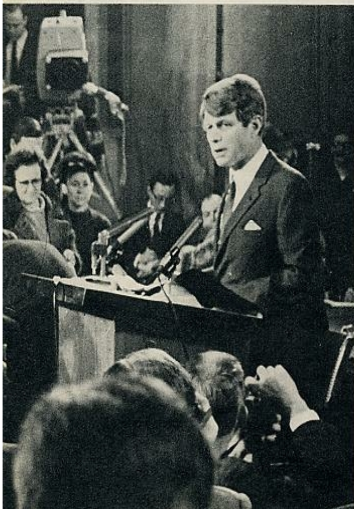
Las acusaciones de oportunismo llegaron inmediatamente. La paz parece rentable.