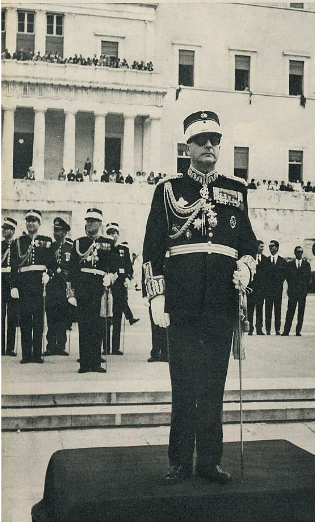
El teniente general Zoiakís, regente de Grecia, presidiendo el gran desfile militar que se celebra todos los años en la plaza de la Constitución de Atenas. Otros años ocupaba este lugar el Rey Constantino. A la derecha, Melina Mercouri, que emplea ahora todo su temperamento dramático en reivindicar las libertades democráticas de Grecia.

su modo, es un coronel Patakos de la prensa británica con su poderosa colección de diarios y semanarios; quizá no tanto como Axel Springer en Alemania Federal, cuya personalidad dirige la mitad de todos los ejemplares impresos que se venden en su país (43 por ciento en la RFA, 75 por ciento en Berlín-Oeste), contra quien en este momento se manifiestan los estudiantes enardecidos por el atentado contra Rudi Dutschke. ¿Dónde empiezan, dónde terminan los límites de una dictadura en nuestros tiempos? La geografía de la libertad tiene fronteras muy borrosas. Una persona a la que el mundo ha tenido por frívola, y lo era en cierta forma, la actriz Melina Mercouri —«En Grecia, antes de los coroneles, nunca pertenecí a un partido político; era solamente una mujer que hacía lo que quería»— explica sus puntos de vista sobre todo ello: «He sabido el atentado contra Dutschke en Berlín y el asesinato de Martín Lutero King en América. Conocí a Martín Lutero King; pasé junto a él horas preciosas. Conocí a este muchacho que yace ahora gravemente herido en Berlín. Sé lo que está pasando en el mundo: ¡el mundo está ardiendo! Tengo ahora la sensación de lo que está ocurriendo en el mundo. Me siento más próxima a los vietnamitas o a los negros de América. Soy menos egocéntrica con respecto a Grecia porque en todas partes está ocurriendo lo mismo. Todo está relacionado».