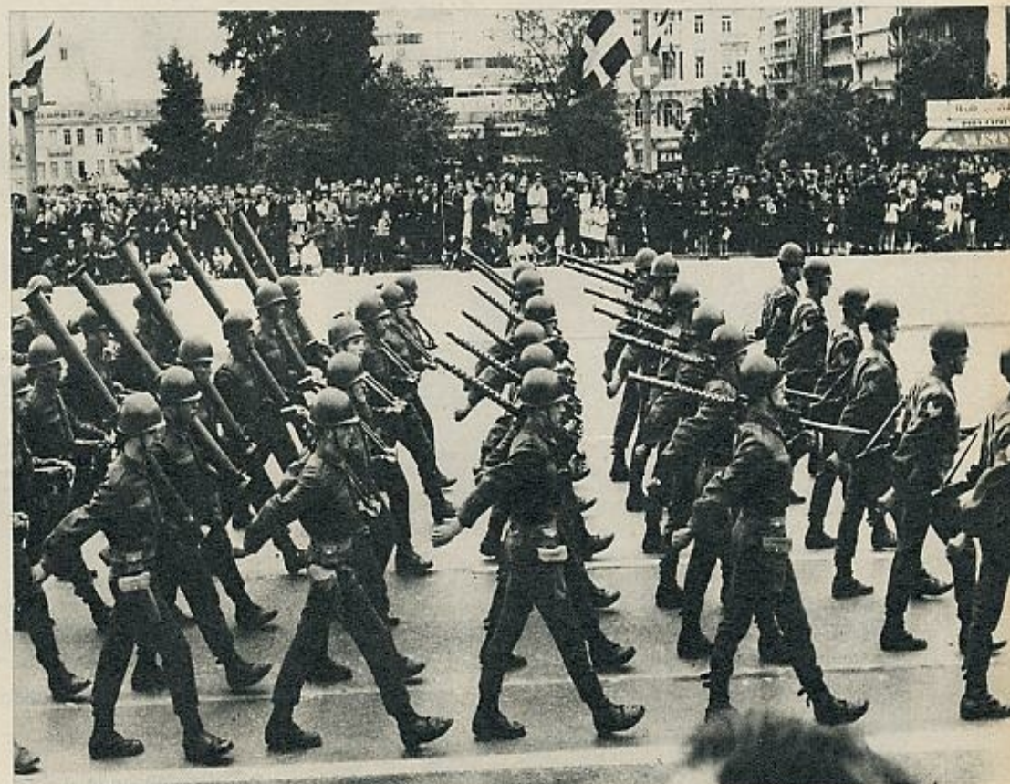
El desfile fue una demostración de los modernos medios técnicos y armas con que cuenta el ejército griego.