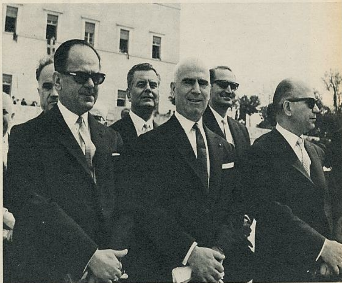
El primer ministro Papadopoulos, a la izquierda, con el vicepresidente Patakos y Makazesos, ministro de Coordinación.

Todo ello constituye la democracia-ficción, y de este pacto escapó Grecia hace un año. El Rey Constantino lo estaba consiguiendo con una serie de acciones prudentes aunque llamativas. Todo hubiese salido probablemente bien, cuando sobrevino el golpe de estado: el 21 de abril, a las dos de la mañana, los tanques salieron a la calle. La Constitución quedaba suprimida, la censura aparecía en la prensa, la policía practicaba siete mil detenciones. Fue, sin duda, una torpeza. Los demás miembros del club quedaron consternados. Los países escandinavos denunciaron el caso a la Comisión de Derechos del Hombre. Gran Bretaña, vieja amiga de la monarquía griega, ordenó reserva a su embajador. Los Estados Unidos tardaron en reconocer al nuevo régimen. Sin embargo, no tardaron en prestarle ayuda. Aun ahora, tras su decisión de restringir gastos en el exterior, Grecia ha quedado excluida de las medidas mediante el juego de incluirla entre los países subdesarrollados, premio que no han merecido otros de sus favoritos. En diciembre, el Rey Constantino se exilió a Roma: desde entonces hay idas y venidas entre Atenas y Roma. El joven monarca trata de convencer a los coroneles que dirigen el nuevo régimen de que se subordinen a las reglas del club: todo puede ser, finalmente, lo mismo, pero con