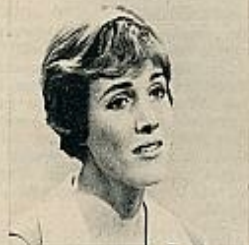
JULIE ANDREWS ...y sus voces...