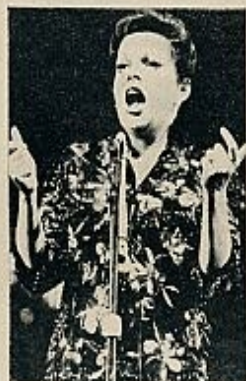
JUDY GARLAND ...y sin imagen

Al margen de las de Arte y Ensayo, dos salas madrileñas proyectan en este momento películas en versión original. Dos salas «especializadas» en grandes espectáculos, de esos cuya duración se cuenta en meses y no en semanas. Se trata, en ambos casos, de films musicales, en los cuales se ha preferido conservar las voces de la banda original —sean las de los intérpretes en imagen o no— antes que adulterarla mediante la inclusión de unas voces españolas que no se adaptan a lo que vemos en la pantalla y de unos textos que, en el mayor de los casos, se adaptarían aún menos. Evidentemente, todo esto es de la más pura lógica. Pero como, precisamente, no es la lógica lo que siempre se impone, el hecho merece ser señalado y saludado.