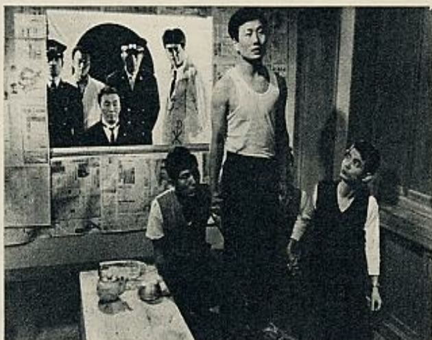
Paralelamente a la proyección de los films en concurso transcurre la de los del Mercado del Film, que constituye un Festival suplementario. Este año ha llanado la atención la presencia de un lote japonés, compuesto de varios films interesantes. En la foto, un plano del titulado «El ahorcamiento».