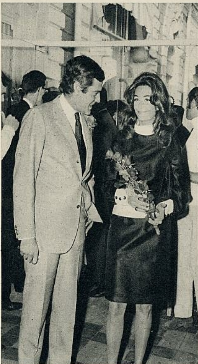
Anouk Aimée y Omar Sharif —que ruedan en Italia una película— asistieron a la sesión inaugural y, con anterioridad, a un cóctel —donde fue obtenida esta foto— ofrecido por la Metro-Goldwyn-Mayer para el nuevo lanzamiento de la versión en sesenta milímetros de «Lo que el viento se llevó».