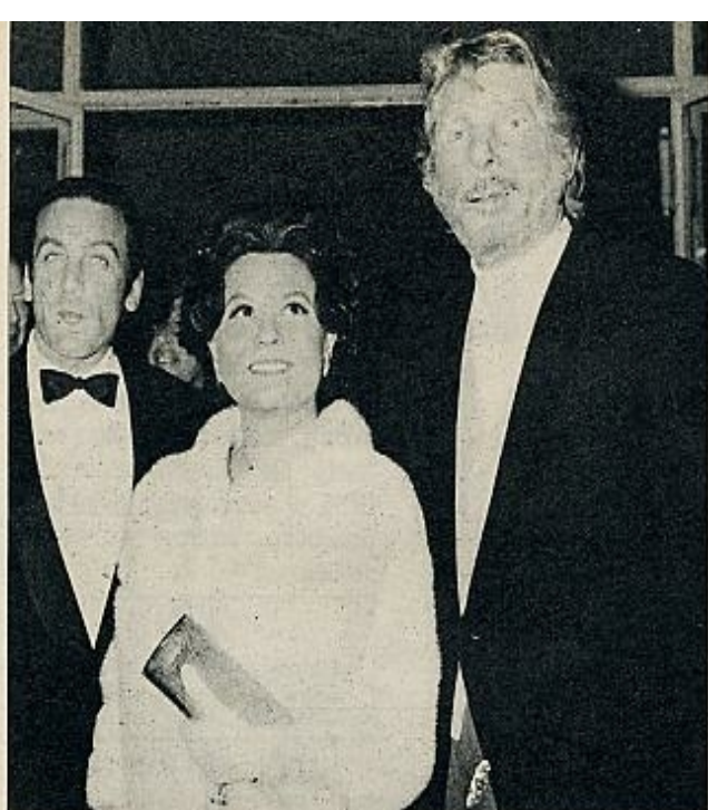
Giulietta Masina y Danny Kaye ruedan en Niza «La loca de Chaillot», al lado de Katherine Hepburn, Oscar 68, que hasta ahora ha brillado por su ausencia. En la foto inferior, Roman Polanski y Sharon Tate. El realizador de «Repulsion» se encuentra en Cannes como jurado, acompañado de su mujer.