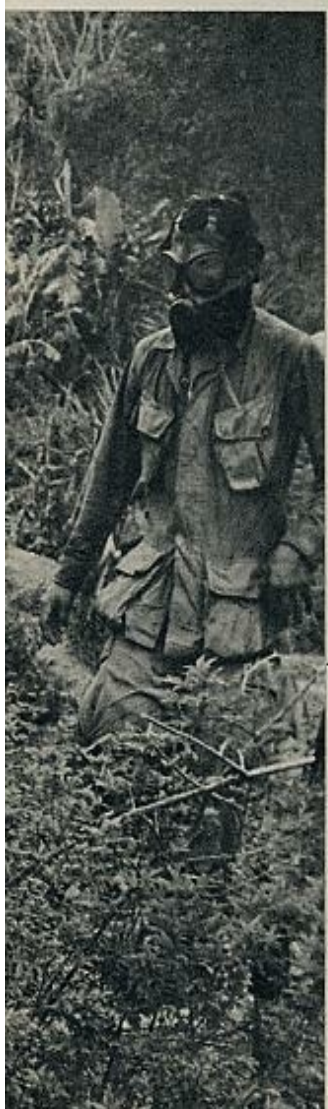
Marines norteamericanos en una misión especial en el Sur de Vietnam. Localizado un grupo de guerrilleros y bombardeada la zona, se procede luego al ataque con gases sobre las cuevas. Un soldado herido es retirado por sus compañeros, protegidos todos con caretas antigases.