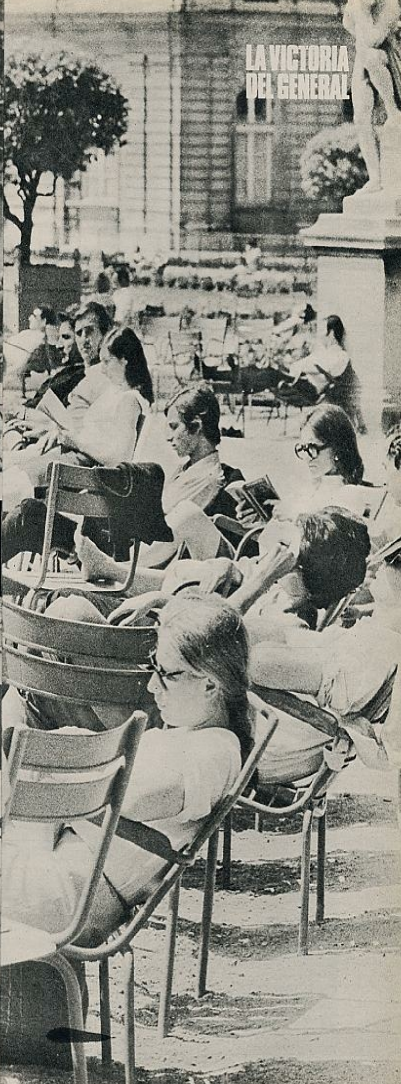
estas elecciones, han quedado paradójicamente fuera de ellas. Arriba, jóvenes en la Fontaine Saint-Michel, en el Barrio Latino y, a la derecha, una terraza del jardín de Luxemburgo. Las fotografías fueron obtenidas el domingo 30 a las doce y a las tres de la tarde respectivamente. Abajo, la Facultad de Medicina: "el pouvoir étudiant", una ilusión de mayo. Los afiches electorales: "pouvoir populaire", "salaires légers, chars lourds"...