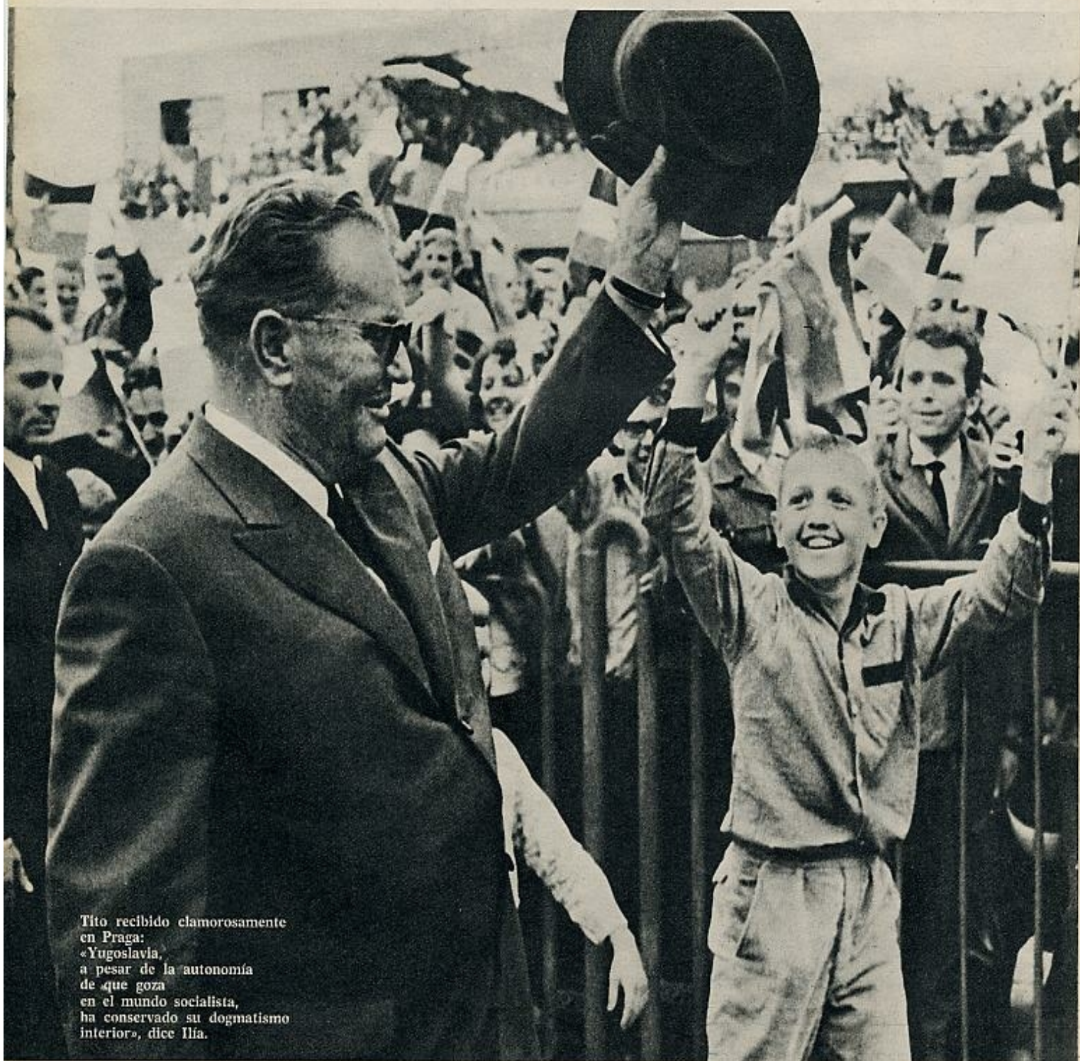
Tito recibido clamorosamente en Praga: «Yugoslavia, a pesar de la autonomía de que goza en el mundo socialista, ha conservado su dogmatismo interior», dice Iliá.

I.—Es absolutamente falso. En Checoslovaquia no hay ninguna