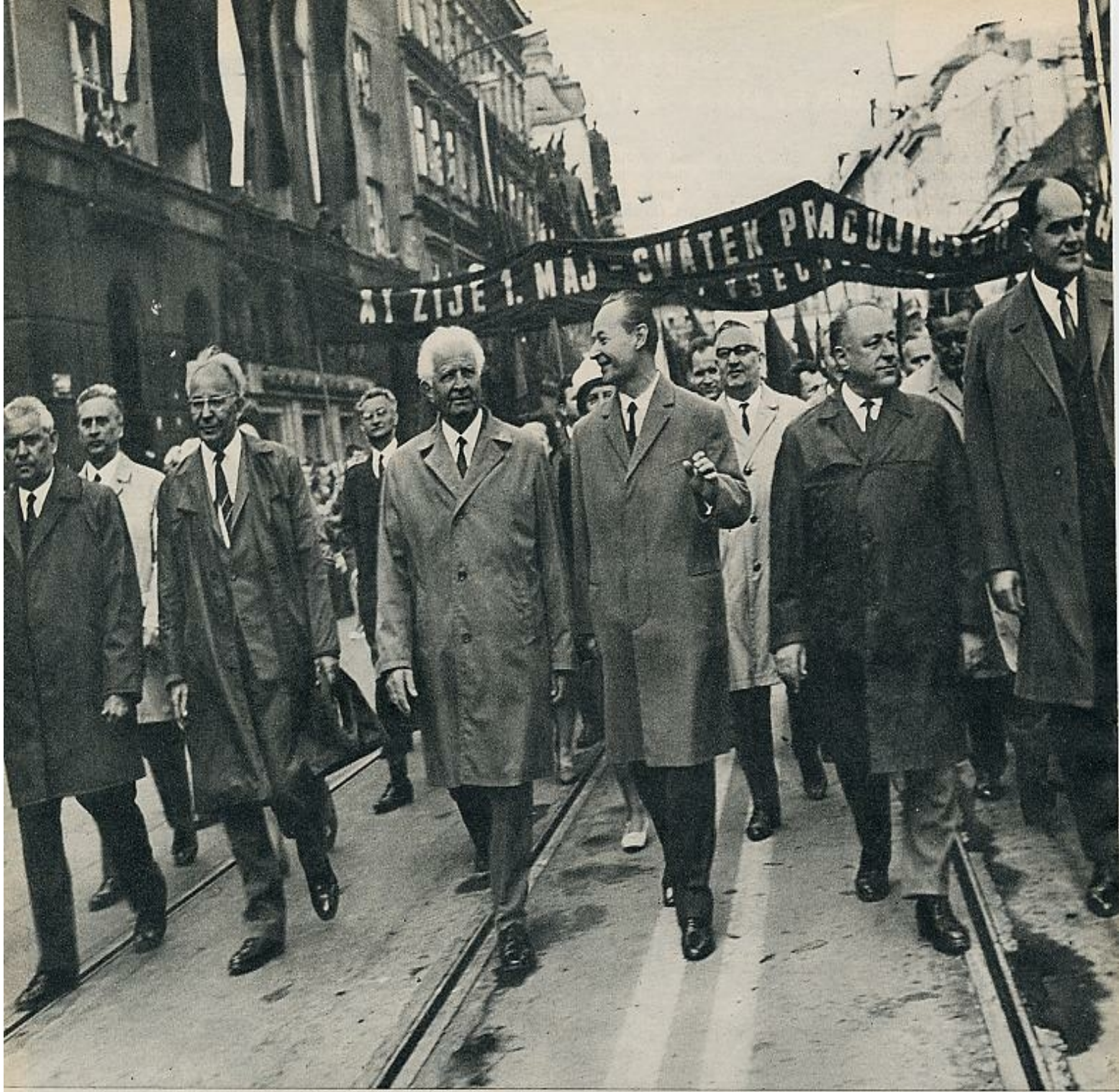
El presidente Svoboda y Alejandro Dubcek con Vasil Bilak (a la derecha): Bilak parece haber colaborado con los soviéticos y es miembro del Comité Central, pertenece al P. C. Eslovaco y podría perfilarse como un segundo Novotny. El problema estaría en hallar un sustituto a Dubcek.

instrucciones. Los jóvenes, en especial, no cederán.