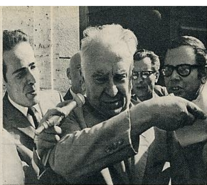
Luigi Longo, secretario general del partido comunista italiano, al salir de su entrevista sobre Checoslovaquia con los dirigentes franceses.

• Lo que reclamamos es una «contestación» positiva, una posibilidad de control, propuestas concretas. Para obtener esto hemos apoyado a Dubcek, afirmando incluso al gobierno que «le apoyaríamos por las armas mientras hiciera aquello para lo que se le había mandado». Ibamos a sentar las bases de una resistencia en el caso de que fuerzas