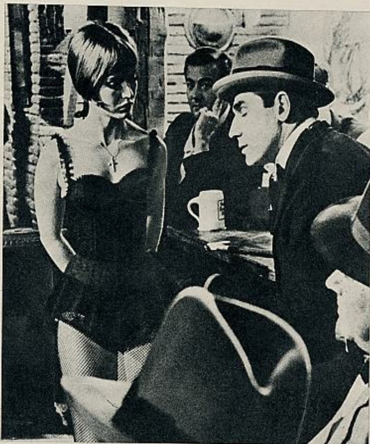
Marie France Pisier, compañera de vacaciones de Daniel Cohn-Bendit, en «El vampiro de Düsseldorf», con Robert Hossein.