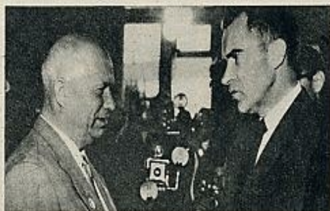
VISITA A KRUSCHEV

Con motivo de una gira artística por América del Sur, Unión Soviética y África, el vicepresidente Nixon recibió a Louis Armstrong, el famoso «Satchmo». En la fotografía, el «rey del jazz» explica a Nixon la técnica que utiliza para tocar la trompeta.