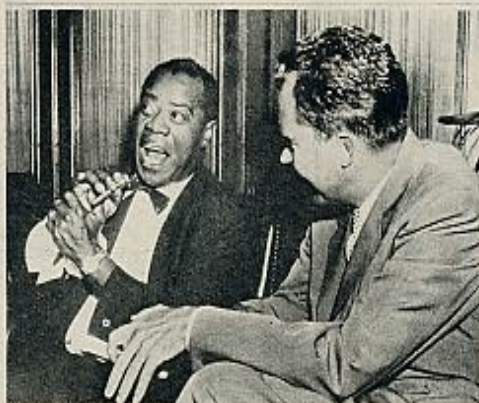
CON EL «REY DEL JAZZ»

«Quiero dejar sentado que me opongo absolutamente a la disten-