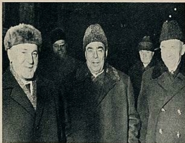
KOSYGIN REAPARECE EN PÚBLICO, CON KADAR Y BREZNEV.