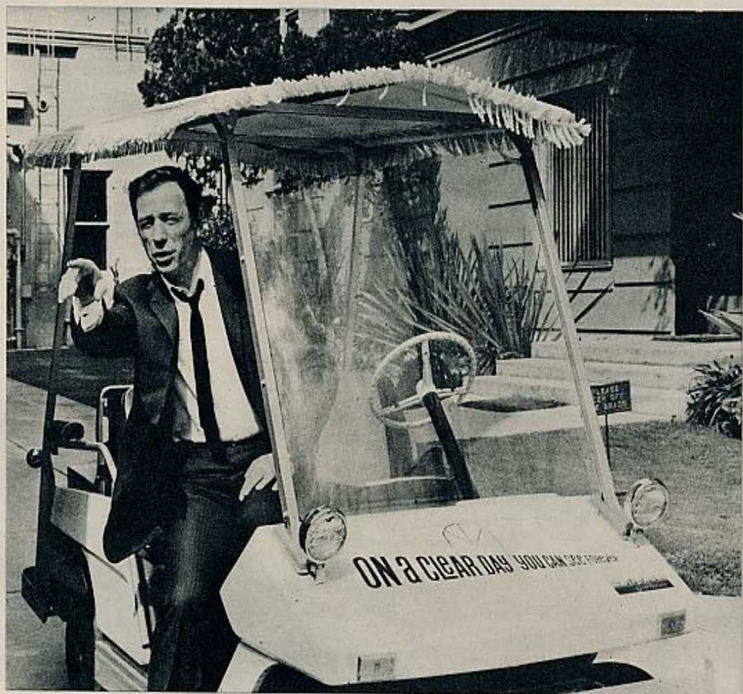
Un poblado del Oeste, uno de los muchos escenarios de "En un día claro puedes ver para siempre". Yves Montand trabajó anteriormente en Hollywood, junto a Marilyn Monroe —"El multimillonario"— y Lee Remick —"Réquiem por una mujer"—.