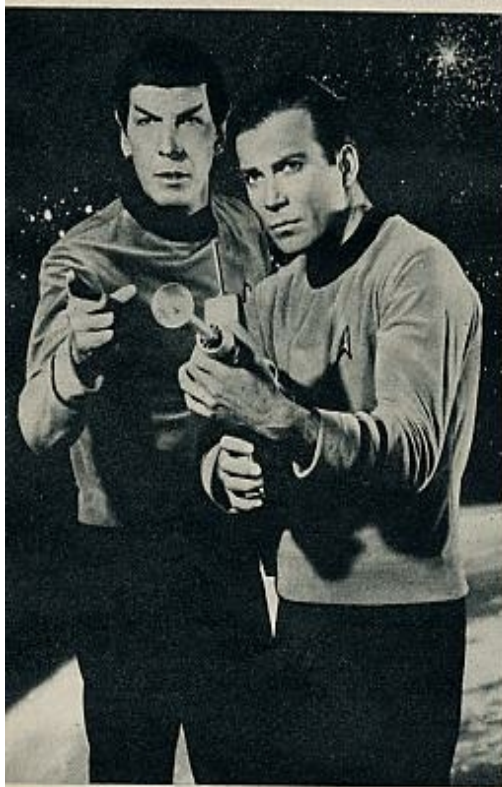
Mr. Spock, el ciudadano de Vulca, asimilado a la cultura y moral terráqueas, indica al capitán Kirk la forma más rápida y eficaz de contrarrestar los perñidos desgnios de los habitantes de otras galaxias

El joven astronauta americano encontró en una isla desierta a una bella genio, con la que convive luego en su apartamento de Houston. Los problemas diarios y profesionales, resueltos por expedientes mágicos.