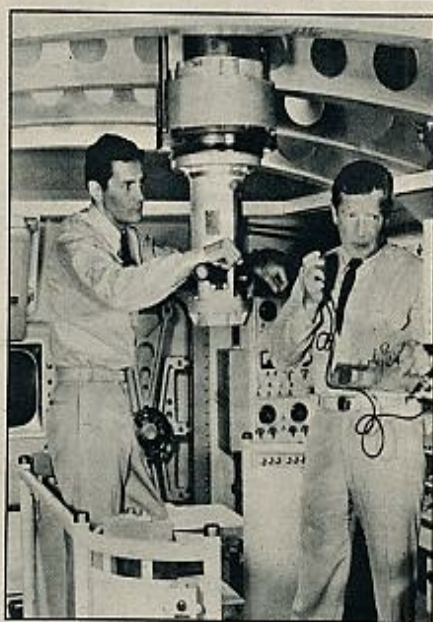
El comandante Crane y el almirante Nelson, a bordo del submarino atómico que se encuentra ya cumpliendo su semanal misión secreta, en defensa de la humanidad, contra extraños y poderosos enemigos de nuestra raza.

novelas establecen un proceso crítico a las bases económicas de nuestra actual civilización: son, por lo tanto, obras positivas y hasta cierto punto optimistas, puesto que nos hacen ver claro el confuso estado de cosas del tiempo presente y la inevitable posibilidad de degradación, si no hay un remedio enérgico y expeditivo.