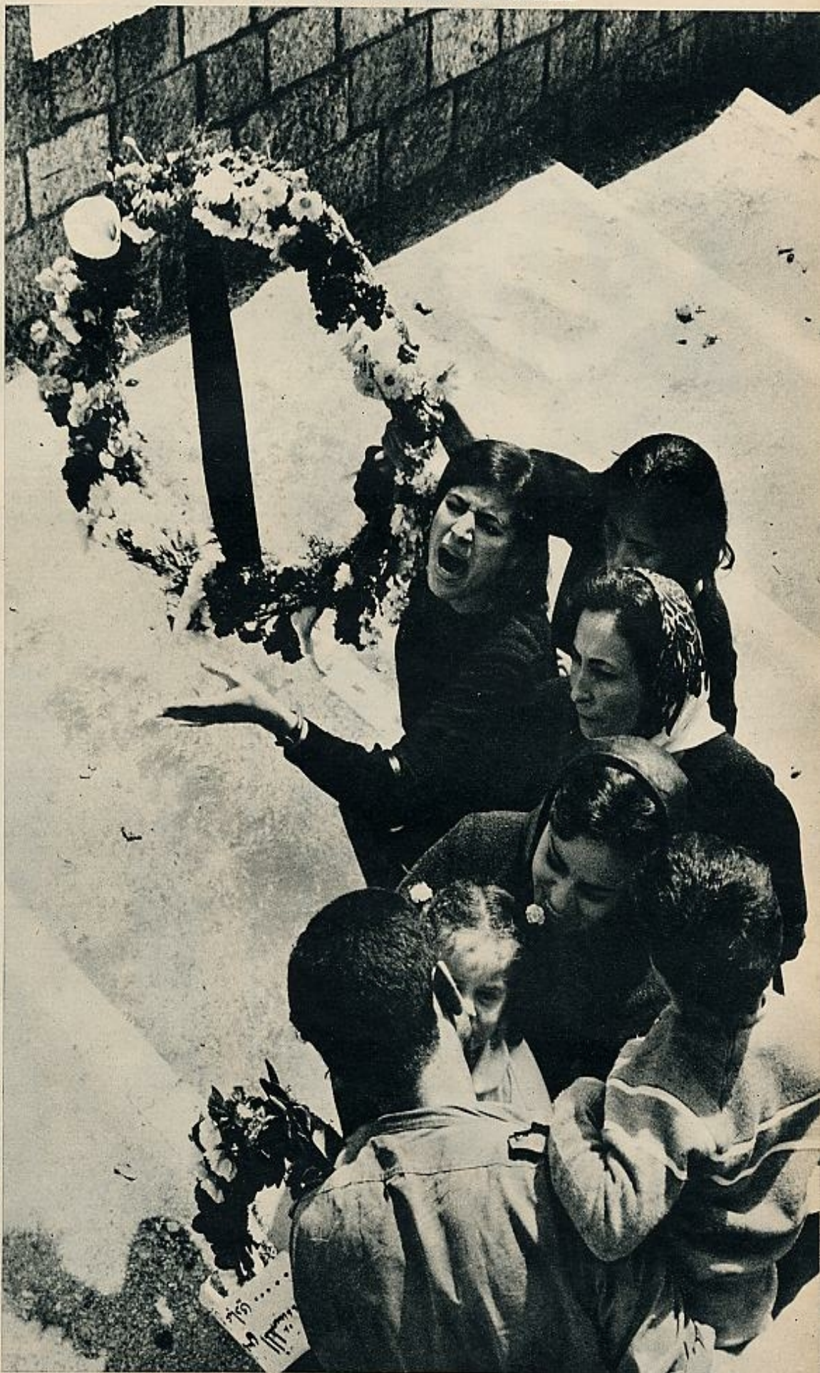
Las manifestantes palestinas intentaron colocar unas coronas en la tumba de un árabe, muerto en la cárcel. La manifestación fue disuelta duramente... Escenas como ésta se repiten con frecuencia.

En cambio escuchó una especie de sospechoso sonido de reloj dentro de la bolsa. Llamó a un policía que patrullaba en la acera de enfrente, que corrió con la bolsa al prado más cercano. Allí, el policía depositó el peligroso objeto y se puso a cubrirlo. Pocos minutos más tarde, la bomba de Fatmah de-