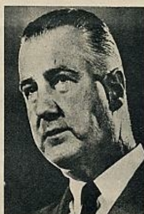
NIXON-AGNEW: OPPOSICION VERBAL

Los peores enemigos del presidente Nixon en Washington elevan diariamente sus plegarias para que se conserve intacta la salud del presidente que no les gusta. La razón es que si Nixon muriese, ascendería a la presidencia, automáticamente, el actual vicepresidente, Spiro Agnew, y ello podría considerarse —creen— como una catástrofe nacional. Ya durante la campaña electoral los términos en que se expresaba Agnew le costaron bastantes votos a Nixon, hasta que consiguió reducirle al silencio. Después de las elecciones, Agnew pareció entrar resignadamente en el papel borroso y oscuro de todos sus predecesores en la vicepresidencia, incluyendo a los que luego se «revelaron», como Johnson, como Truman o como el mismo Nixon. Pero la verbosidad y el anecdotario del actual vicepresidente, de origen griego y carácter mediterráneo, emergen de la oscuridad y, para ello, tiene que ser contradictorio y paradójico. En el momento en que el país estallaba en un júbilo visible, espectacular y llamativo por la aventura lunar, Agnew ha declarado por su cuenta que no era partidario de esta aventura, y que ahora haría todo lo posible por evitar que se siguiese gastando dinero en la exploración espa-