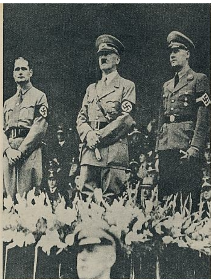
Hess fue el número dos del partido nazi y el tercero en la línea de sucesión a la jefatura del Estado.

debe tener nada de común con la masa. Como todos los grandes hombres, es ante todo una individualidad. Si la necesidad lo ordena, no vacila ante la efusión de sangre. Las grandes cuestiones se resuelven siempre a sangre y hierro. Para alcanzar sus objetivos, está dispuesto a caminar sobre los cuerpos de sus mejores amigos. Aquel que hace la ley procede con una implacabilidad terri-