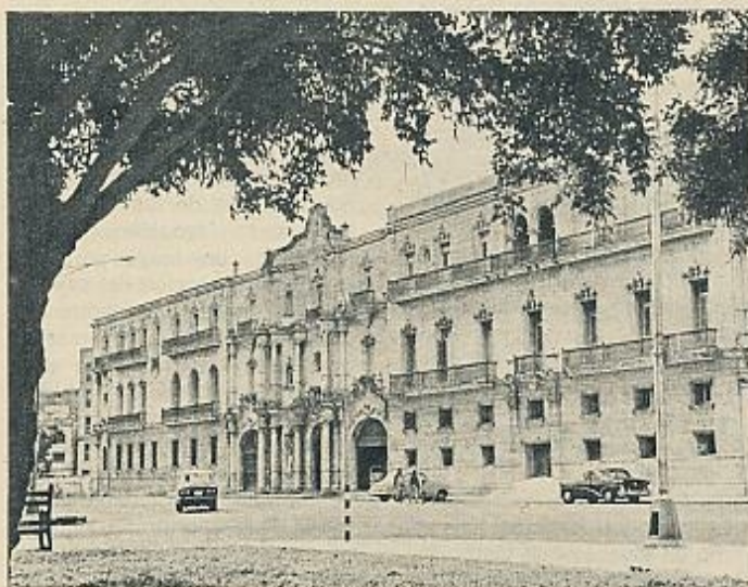
El seminario de San Carlos, en La Habana, ocupa un antiguo edificio del siglo XVIII, construido por los jesuitas. Cuando éstos fueron expulsados de España y sus colonias en el reinado de Carlos III (1767), el primer obispo cubano, Santiago José de Hechavarría, acondicionó el lugar para escuela de futuros sacerdotes. Hoy el seminario funciona con las aportaciones voluntarias de los católicos cubanos.

Aguardamos la hora del almuerzo (que sería judías, huevos fritos, arroz, pan y naranjas). El día es caluroso a pesar de la fecha y es una suerte estar sentados al fresco en el cómodo sofá de la galería. Sobre el cristal de la mesa hay un cenicero inexplicable que empuja a consumir «Johnnie Walker». Se lee: Born in 1820 and still going strong. Pienso que el seminarista nació en 1769. Pienso también que, refiriéndose al propósito del Concilio, Juan XXIII arriesgó una imagen literaria: «Abrir las ventanas para que entre el aire fresco». No hay duda que en San Carlos el aire fresco ha entrado. ■ (Prensa Latina)