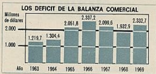
Fuente: Estadística de Comercio Exterior de España. Dirección General de Aduanas.

de bienes de capital, que pone de manifiesto, una vez más, la fuerte dependencia del crecimiento industrial con respecto al sector exterior; en efecto, ha bastado que se confirme la reactivación iniciada en 1968 para que las importaciones de bienes de capital con destino a la industria se hayan disparado, registrado un crecimiento del 15,9 por 100 en los diez primeros meses de 1969, sobre igual período del año anterior.