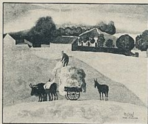
"VICALVARO", DE FRANCISCO SAN JOSE.

son aliados, factores aglutinantes, miembros de pleno derecho en el concierto de su pintura. No, claro: Pérez Gil ya no tiene nada que ver con el impresionismo, aun cuando sea su descendiente... como casi todos los paisajistas actuales. La pintura es —también para él— una cierta «cosa mental». Hasta tal punto es eso así que el factor primordial en ella ya no es el sol: es la construcción; la ley previa, el orden a que debe someterse —según él, que es un constructor— toda definición pictórica. Es curioso eso