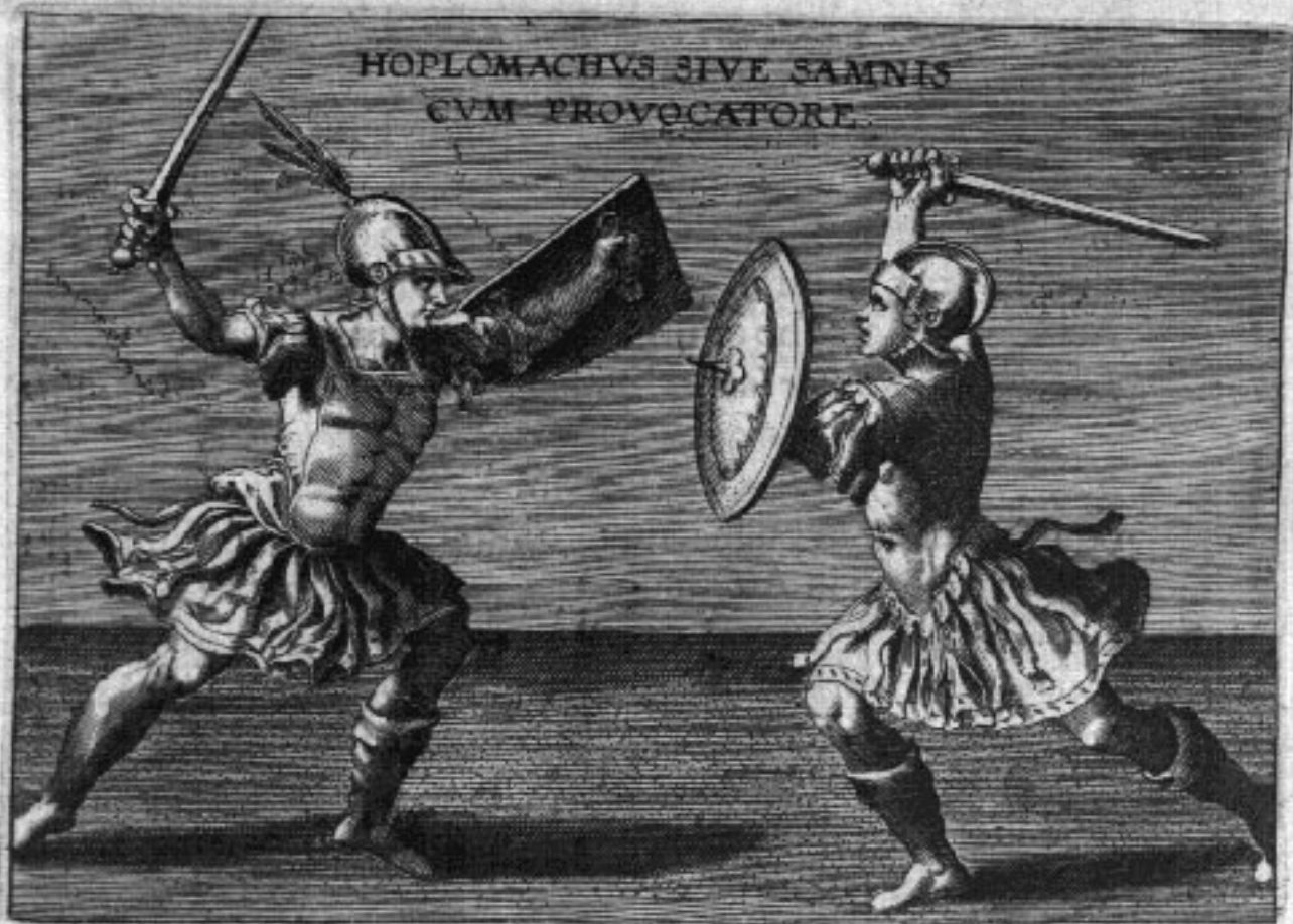
HOPLOMACHVS SIVE SAMNIS CVM PROVOCATORE.

* Nam fieri potest, ut peregrinum nomen sit, ut Myrmillo.