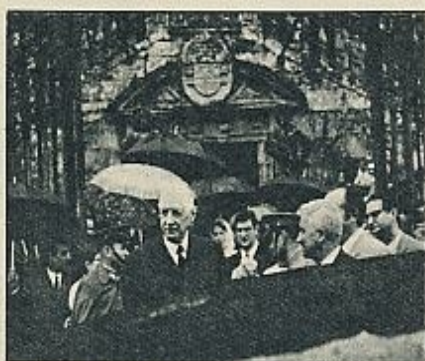
De Gaulle, ante la catedral de Santiago.

La llegada a Santiago fue memorable. El «tiburón» negro del general se detuvo a las puertas de la catedral. Llovía. De Gaulle salió del «tiburón», subió las escaleras de la entrada del Obradoiro y, acompañado por dos canónigos, se despachó la catedral en un cuarto de hora. Es un record en la historia de las peregrinaciones. Recorrerse la catedral de Santiago, con parada y éxtasis ante el Pórtico de la Gloria, el tesoro, la cripta, la capilla del Rey de Francia, rezar luego un poco ante el altar del Apóstol y ver funcionar el «botafumeiro», todo esto en un cuarto de hora, es algo que no se recuerda en Santiago de memoria de peregrino. Claro que el anciano general ya había demostrado su excelente forma física y mental entrando en Galicia por carretera, y apéandose del automóvil, luego de tan heroica gesta, sin tambalearse ni mostrar en la mirada ningún síntoma inquietante de perturbación psicósomática. ¡Admirable viejo! Todo erguido y juvenil, aunque un poco pálido. Esto debe ser por lo de escribir. Se nota que se ha pasado muchos meses dale que dale a sus «Memorias». Esto de escribir le deja a uno muy paliduchó. Al verle, uno, que es muy sensible al «mito De Gaulle», sintió en la médula un tremendo escalofrío, que se imagina debe ser el escalofrío de la Historia. Y también uno, que es un poco bárbaro y tenía complejo por haber visto el Museo del Louvre en una hora y cuarto, se sintió al fin