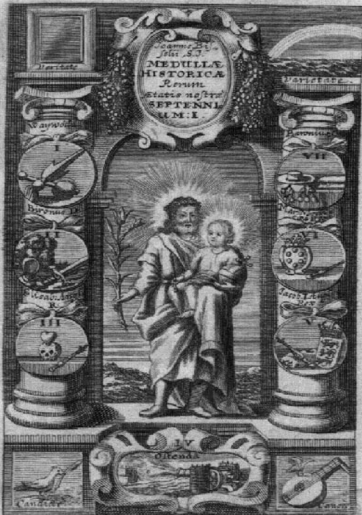
Tab. Aetate de Aetate