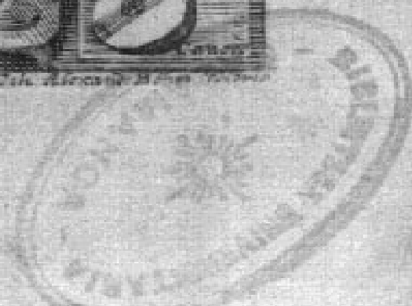
Tab. Aetate de Aetate