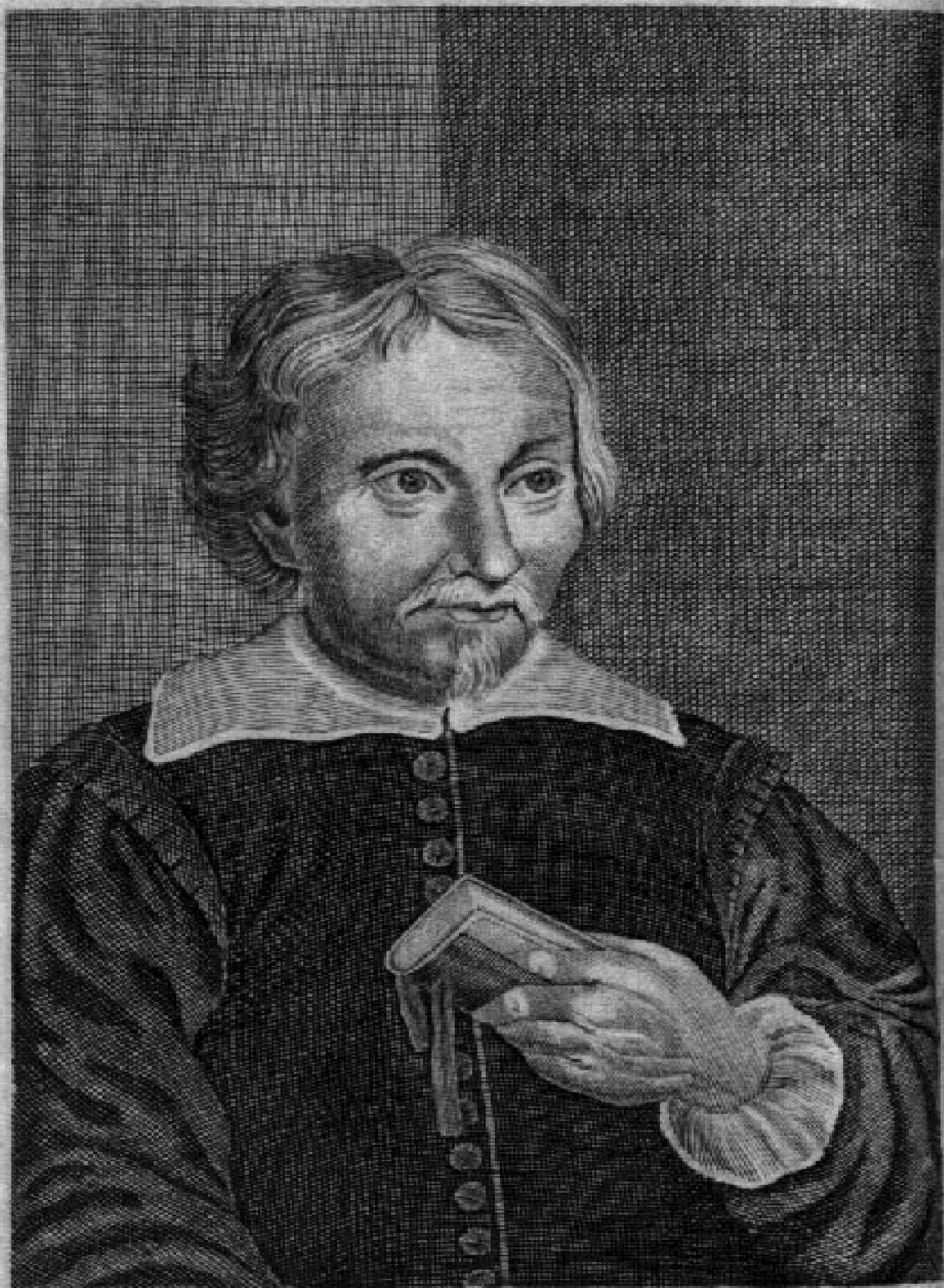
IANVS NICIVS ERYTHRÆVS.