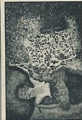
FRANCISCO PEINADO: «Evaporación».

dir a la intrincada selva de los vegetales más elementales, a seres minúsculos, agrandados por su ojo, habitantes de ese mundo. Y dentro de todo ello, cuando se refiere al elemento humano, a una ambigüedad en la que la condición germinativa y la condición levemente putrefacta de las cosas, se amalgaman, como si quisiera asegurarnos que la vida se produce en la muerte y al revés, que los gusanos, que también son vida, proliferan sobre los cadáveres.