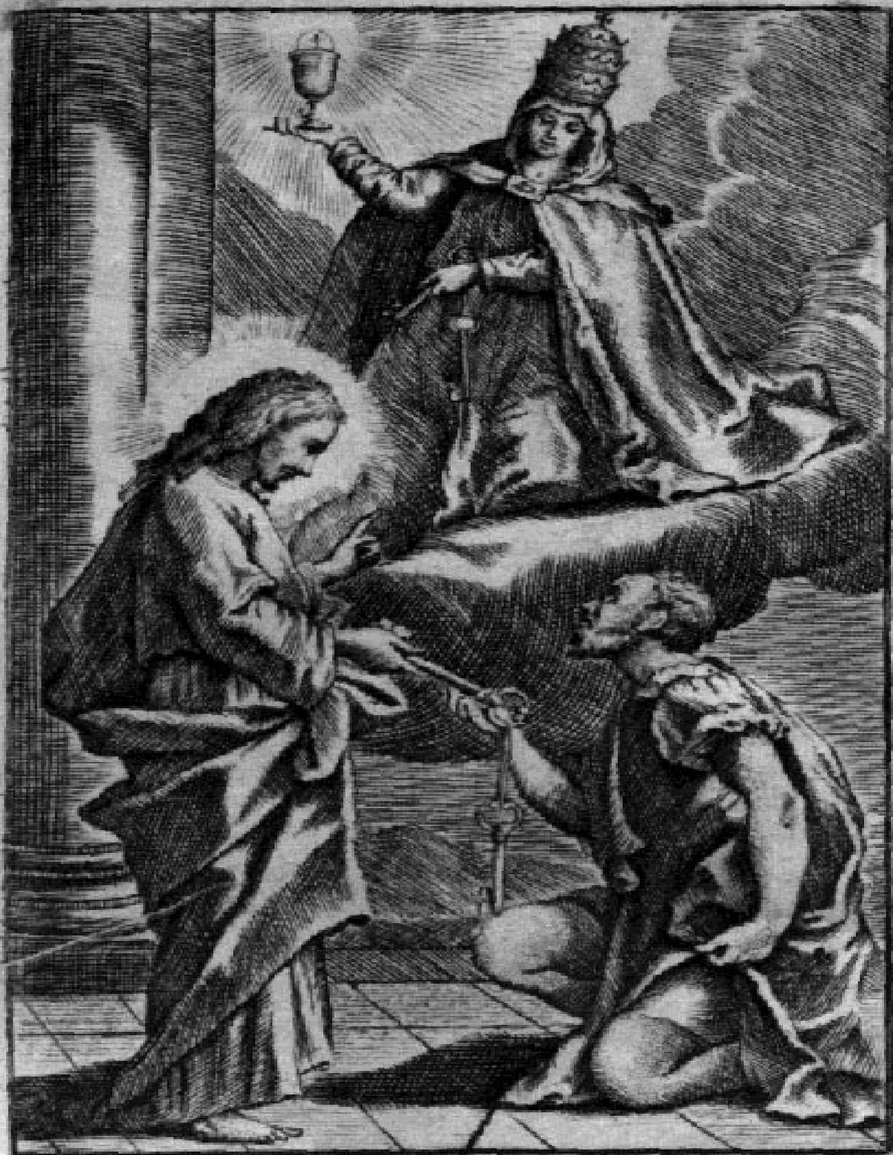
Patauų Typis Seminarj