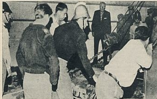
Las llamadas guerrillas urbanas de la Acción Revolucionaria —anarquista— aprovecharon la inauguración de la OTAN para volar el principal centro de comunicaciones de Lisboa.

J OSEPH Luns, el nuevo secretario general, es viejo partidario de una Europa supranacional, ha culpado más de una vez a Estados Unidos de haber debilitado a Europa —sobre todo, es su punto de vista, por haber precipitado las descolonizaciones y haber causado la pérdida de los imperios europeos, y muy concretamente el holandés—, pero, por otra parte, considera que la actual forma de los Estados Unidos es irremplazable: cree que «la seguridad europea no se concibe más que en relación estrecha con los Estados Unidos, en una integración cada vez más adelantada dentro de la OTAN». Suyas son, también, estas declaraciones: «Si pudiéramos elegir, nos gustaría, probablemente, más ver a Francia representando en el mundo un papel más preponderante que el que los Estados Unidos, pero somos realistas, y sabemos que las naciones europeas, separadamente, no pueden ya representar ese papel determinante». Joseph Luns es un hombre que conviene a los Estados Unidos en este puesto, como les convenía Manlio Brosio. Son dos «duros». Es decir, tienen el espíritu conservador y beligerante de la OTAN, quizá el único que pueda tener la OTAN mientras exista. Considerarles a ellos y a la organización como negociadores con los adversarios es irrelevante.