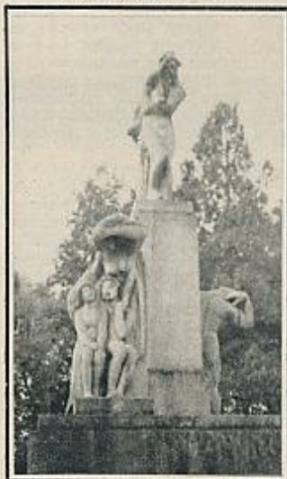
Monumento a Servetus en Vienne del Delfinado, donde ejerció la Medicina durante varios años.