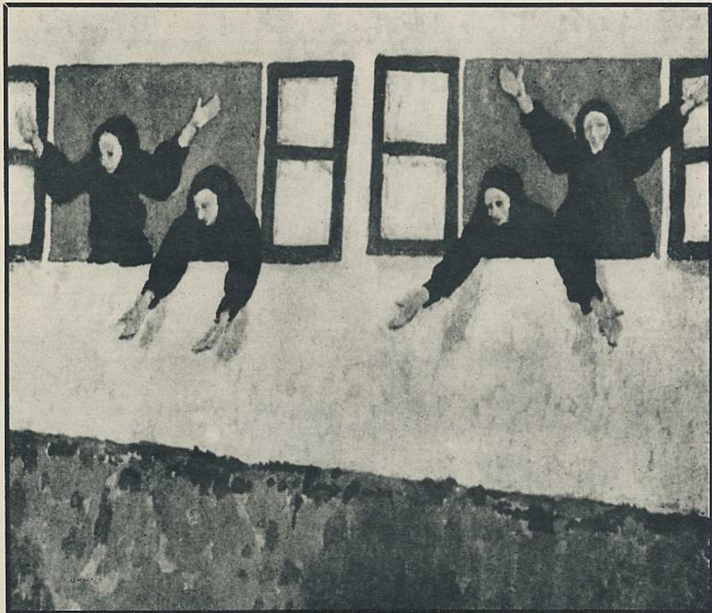
Cuadro de Castelao.

El ritual protector de la casa hay que reactivarlo periódicamente a lo largo del año. La noche víspera de San Juan es prominente en este sentido. La hoguerita protectora de la casa, encendida enfrente de la puerta, ya queda reseñada. Además colocan toda una serie de plantas, con propiedades místicas, por puertas, ventanas, vanos y rendijas para que no entren las meigas, «para que no enmeiguen la casa» Por las aldeas de Cedeira «ponen flores... herbas de Nosa Señora e funcho [hinojo] en ventanas e portas