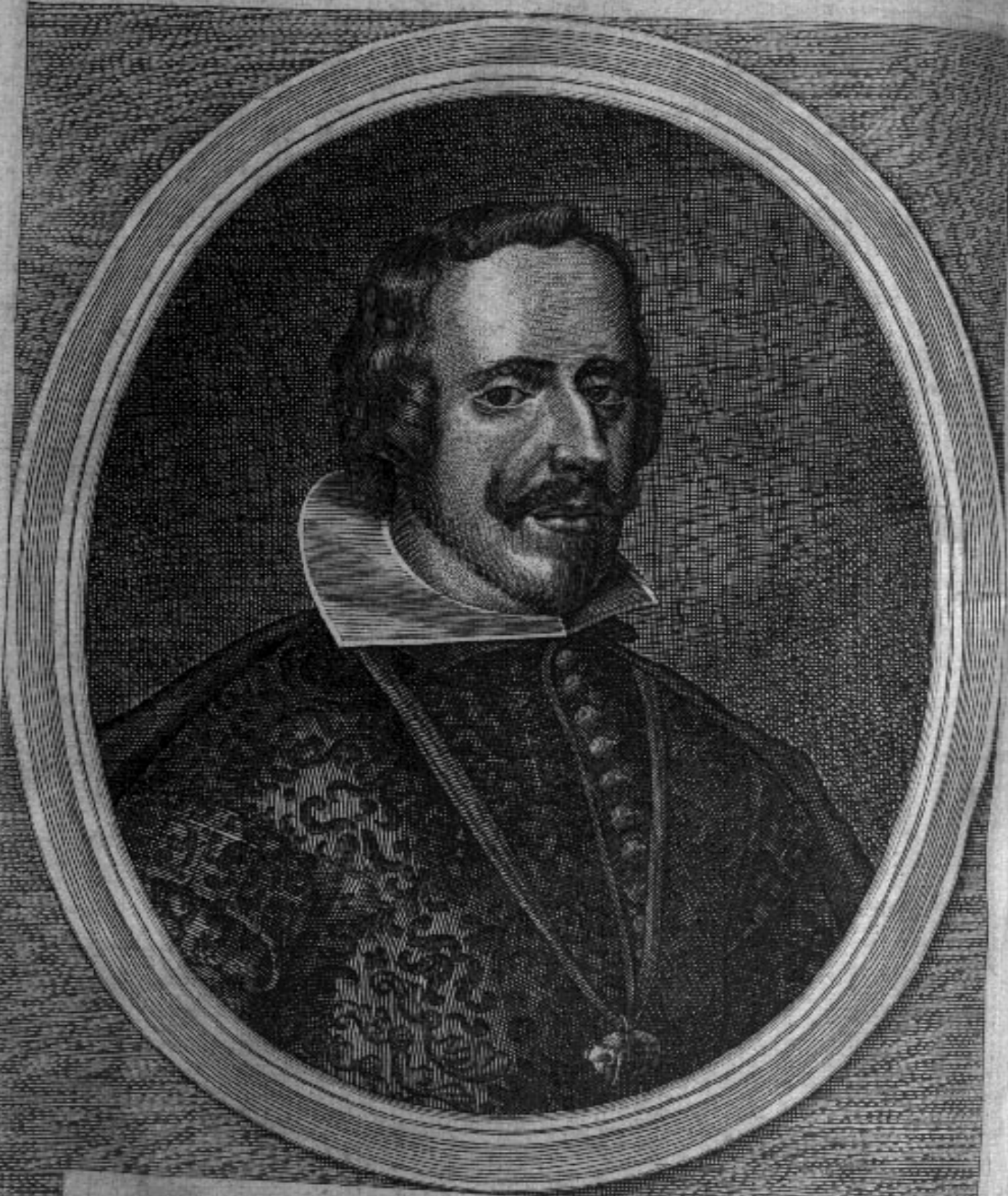
PHILIPPUS IV. HISPANIARUM ET INDIARUM REX CATHOLICUS.