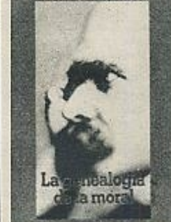
La genealogía de la moral

Neruda. Lumen. SOCIOLOGÍA DE LA LITERATURA, Robert Escarpit. Oikos Tau. GARCÍA MARQUEZ: HISTORIA DE UN DECIDIO, Mario Vargas Llosa. Barral. PRINCIPIOS DE URBANISMO (La Carta de Atenas), Le Corbusier. Ariel.