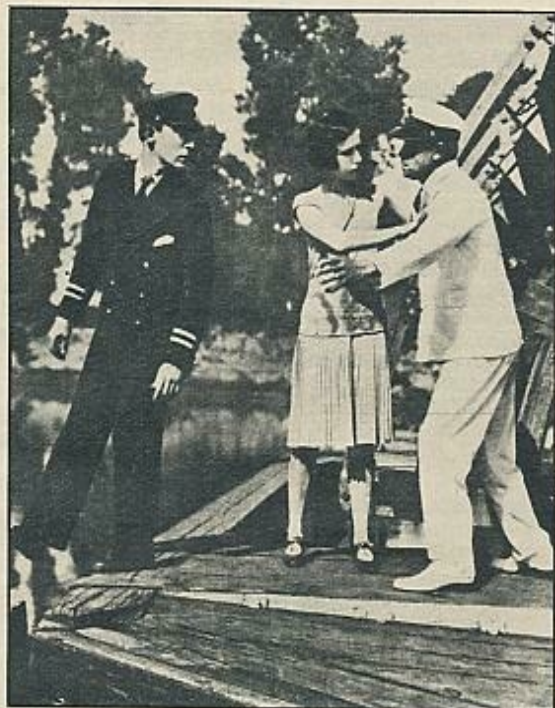
"El héroe del río"

via— son elementos ante los que no cabe más que el estupor y, en último caso, la utilización. Lo que para los demás personajes es destructivo para él es material creativo. El es un impotente que conoce sus limitaciones, pero que intenta siempre encontrar una solución.