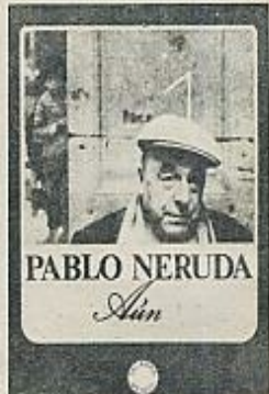
PABLO NERUDA Aun